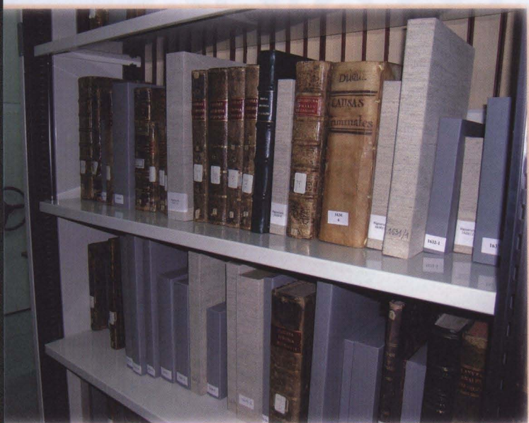
Detalle del depósito

Presta los servicios habituales de préstamo, información bibliográfica, etc. de lunes a viernes en horario de 9 a 14 horas.