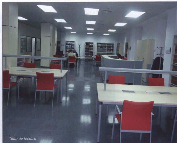
Sala de lectura

La Red difunde sus fondos a través del catálogo colectivo Bibliodef ( http://www.bibliodef.es ); como resultado del problema generalizado de