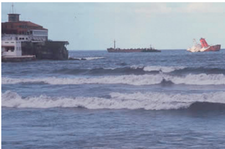
Sección de popa semisumergida del Castillo de Salas .

El episodio sobre la demolición y extracción de los restos de la sección de popa hundida, que conlleva la extracción de los carburantes que aún alberga, es uno de los más desafortunados de este caso, por su larga duración, su defectuosa ejecución y supervisión y su alto coste para las arcas públicas. Cronológicamente, hay dos fases plenamente diferenciadas. La primera, que comienza después del hundimiento definitivo de la sección de proa lejos de la costa, abarca de febrero a octubre de 1986, meses en los que se procede a la extracción parcial de la popa y los combustibles. Quince años después se inicia la segunda fase, con la extracción de «los restos de los restos de los combustibles» entre agosto y septiembre de 2001, y la extracción de «los restos de los restos de la popa» (la zapatilla) entre septiembre de 2002 y julio de 2003, en que se acaba de una vez el desguace de la popa y se elimina el peligro de contaminación de los carburantes del buque sobre el litoral gijonés.