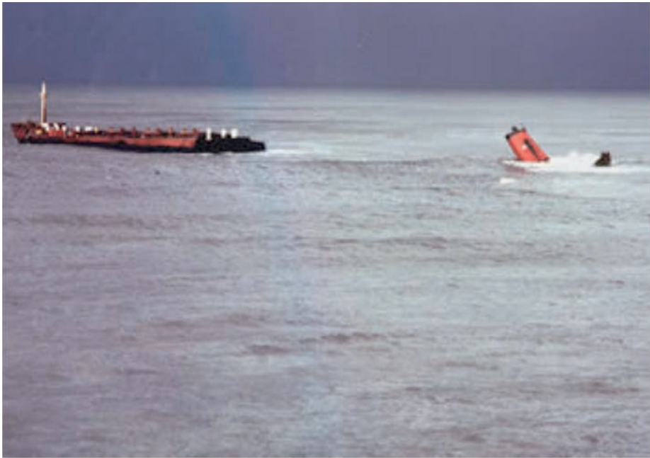
Hundimiento de la sección de popa.

Como en la Comandancia Militar de Marina de Gijón se había abierto el Expediente núm. 3/86 «a consecuencia del embarrancamiento del buque Castillo de Salas en lo concerniente a la Extracción de los restos y contaminación», la autoridad de marina, en base a la Ley 60/1962, de 24 de diciembre, sobre auxilios, salvamentos, hallazgos y extracciones marítimas (arts. 23, 26,1 y 53 L.A.S. de 1962) (28), requiere al naviero la extracción de los restos naufragados, lo cual se plasma en el contrato suscrito entre Elcano y el contratista Fondomar, donde se explicita que la Comandancia de Marina «ha exigido a los armadores que remuevan o contraten la remoción de la mencionada sección de popa del Castillo de Salas » (29).