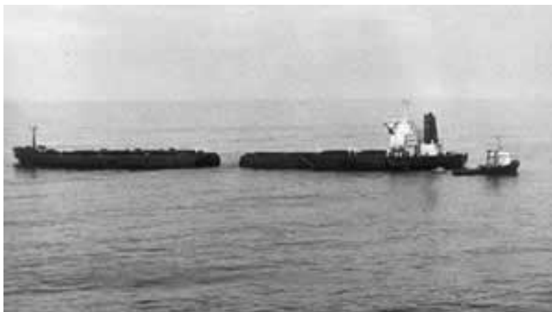
Rotura del buque Castillo de Salas en dos secciones. Hundimiento del Castillo de Salas. Secuelas del mayor desastre ecológico en la bahía de Gijón. Cronología del desastre en fotos. 15 de enero de 1986.

En suma, el informe de la inspección de buques recoge el ambiente técnico inicial sobre el barco, basado en un reconocimiento elemental de la nave siniestrada (exterior y parcial de la obra viva y de la obra muerta) y acuciado por el mal estado de la mar y el tiempo. El inspector acepta el plan de Smit de alijar tanto el combustible como el carbón a otros buques para prevenir la contaminación (21), lo que se considera objetivo prioritario, si bien cinco días después de la varada «es imposible predecir no sólo el éxito sino, en el caso de lograrse, la duración de estos trabajos de descarga del buque y posible intento de recuperación».