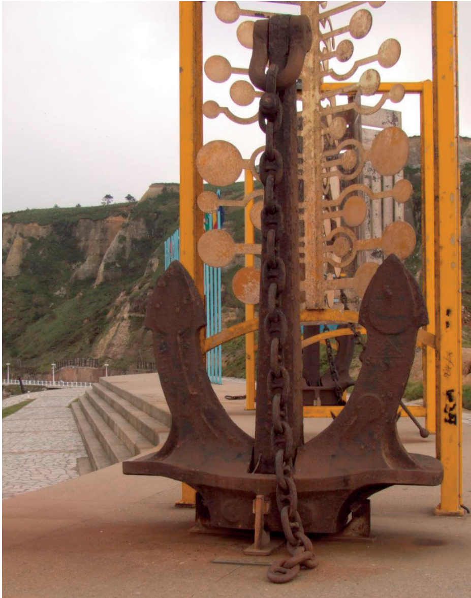
Ancla del Castillo de Salas , expuesta en el Museo de Las Anclas de Salinas (Asturias). ( www.museodelasanclas.es )