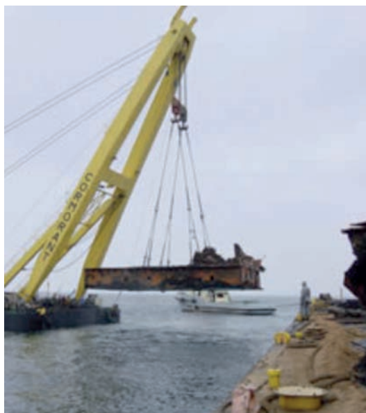
Extracción por el buque grúa Cormorant de restos de la popa del Castillo de Salas .

Sobre este punto, es seguro que la zapatilla se quedó donde estaba con el carburante que albergaba hasta que fue definitivamente extraída en su totalidad en 2003. Seguramente, debería haberse obligado al contratista a proceder a la extracción completa de los restos de la popa, sin excepciones. También, la autoridad de marina debería haber vigilado constantemente la actuación del contratista y no limitarse a un control documental, en un exceso de buena fe, paliada por la falta de medios especializados. Probablemente, la misma buena fe que induce al Principado de Asturias a interesarse en la adquisición de la zapatilla del barco como biotopo o criadero de especies marinas, cuando, a la larga, se manifestará como un serio foco contaminante de fuel hacia las playas y costas de la zona.