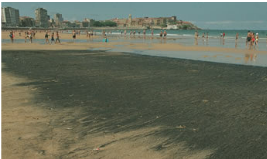
Restos del carbón del Castillo de Salas en el arenal de la playa San Lorenzo de Gijón.

En la jornada del día 15, debido al mal estado de la mar, con oleaje de hasta ocho metros, a causa de la mala posición de apoyo del buque, primero se agrietó y luego se partió en dos secciones, aproximadamente a la mitad de su eslora, entre las bodegas 5 y 6, inundándose, también, la cámara de máquinas y derramándose al mar unas 20.000 toneladas de carbón procedentes de las bodegas 6 y 7 y algunos derrames de hidrocarburos no muy intensos. Ante la situación de evidente peligro para las vidas humanas, el capitán ordena a la tripulación y técnicos de salvamento de Smit a bordo que preparaban el rescate, el abandono de la nave, que, ante la tardanza de los medios aéreos de rescate, se hace por la popa a través del remolcador Scotland , el único que pudo, por el mal tiempo, acercarse al costado del buque. A consecuencia de la rotura del buque aparecen manchas de fuel vertidas por los respiraderos que se combaten con dispersantes por el Mouro y más tarde por el Remolcanosa V .