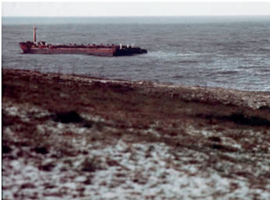
Sección de proa varada del Castillo de Salas vista desde el cerro Santa Catalina.

Una vez que el barco se ha partido en dos, prácticamente por la mitad, se consume el naufragio, con lo que se abandona la idea del salvamento del buque con su carga y se plantea la extracción de los restos de la nave. En general, hay coincidencia en que debe procederse, primero, a la extracción de los combustibles y, posteriormente, al reflotamiento de las secciones del pecio. Debido al peligro contaminante de los carburantes del buque sumergidos en la popa, el planteamiento es calentarlos para hacerlos más fluidos y bombearlos a barcazas, gánguiles y remolcadores. En eso todos están de acuerdo. Pero, respecto al reflotamiento de la sección de proa, los dictámenes técnicos no son unánimes, especialmente en lo que se refiere al eventual e inminente colapso estructural de la sección —opinión mayoritaria— frente a quien no considera tan inmediata su destrucción por el mar. Y derivada de la existencia o no de tal urgencia, se vuelve a discrepar sobre la perentoriedad del aligeramiento, vital para unos y no tan urgente para otro. En el fondo, lo que subyace es la justificación o no del vertido del carbón directamente al mar ante el riesgo y lentitud de trasvasarlo a otros buques.