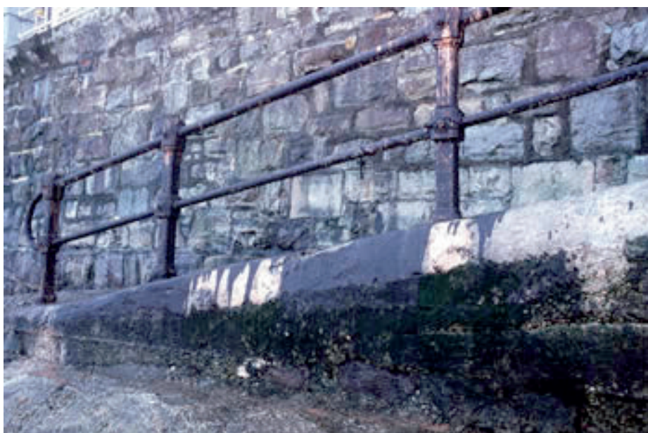
Restos de fuel-oil del Castillo de Salas en una escalera de acceso a la playa de San Lorenzo de Gijón.

Ahora bien, «si los contratistas cumplen y terminan este contrato dentro de los 180 días naturales de(sde) su firma, los armadores pagarán a los contratistas una cantidad extra de un 20 por 100 sobre la cantidad fijada a pagar». Y aunque el contrato contemplaba otros plazos eventuales, al final Fondomar acabó la obra antes de dichos seis meses y cobró el incremento previsto: en total, 187 millones de pesetas. Como luego veremos, Fondomar facturó como obra terminada y completa lo que solo fue una remoción parcial de la popa y una eliminación menor de sus combustibles. En suma, se primó la incompetencia.