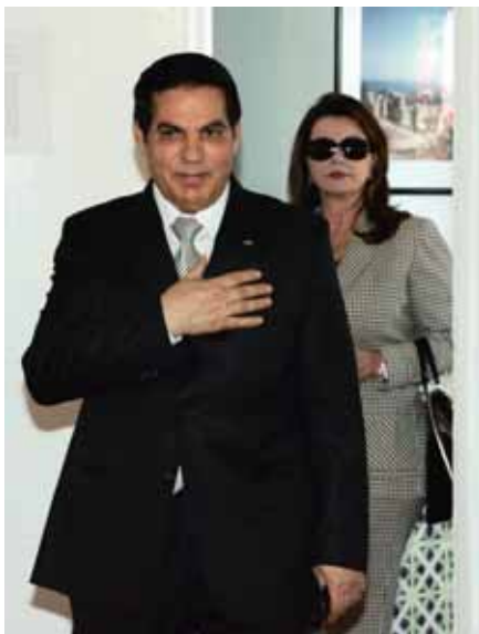
Fotografía de noviembre de 2010 del entonces presidente tunecino, Zine el Abodine Ben Ali y su esposa Leila.

El quinto partido ya legal es el de los islamistas de En Nahda (Renacimiento). Todo indica que su líder en el exilio, Rachid Ghanuchi, regresará a Túnez en los próximos días. Sin embargo, nada más conocerse la caída del régimen de Ben Ali, uno de sus portavoces anunció desde París que no presentarían su candidatura a las próximas elecciones presidenciales. En 1989, siendo ya entonces un partido prohibido, consiguieron, según los datos oficiales, el 17 por 100 de los votos escrutados (ellos afirman que el respaldo fue mucho mayor).