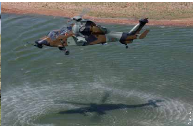
De izqda. a dcha., un soldado de la BRIPAC en el kurdistán iraquí durante la primera guerra del Golfo; un helicóptero de ataque Tigre

democrático era un modelo que miraba básicamente al interior; dirigido a garantizar el orden público y la continuidad del régimen más que a defender unas fronteras de un enemigo exterior, del que nunca existió una gran conciencia social. Por ello un modelo cerrado sobre sí mismo que repercutía en un despliegue dentro de las propias ciudades y una organización pensada frente al «enemigo interior».