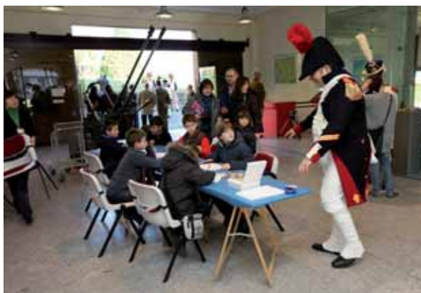
La agenda gallega incluyó actividades para todos los públicos, también para los más pequeños.

de la batalla, a las características de las tropas de uno y otro bando e, incluso, al sistema de alarmas que empleaban los gallegos de antaño.