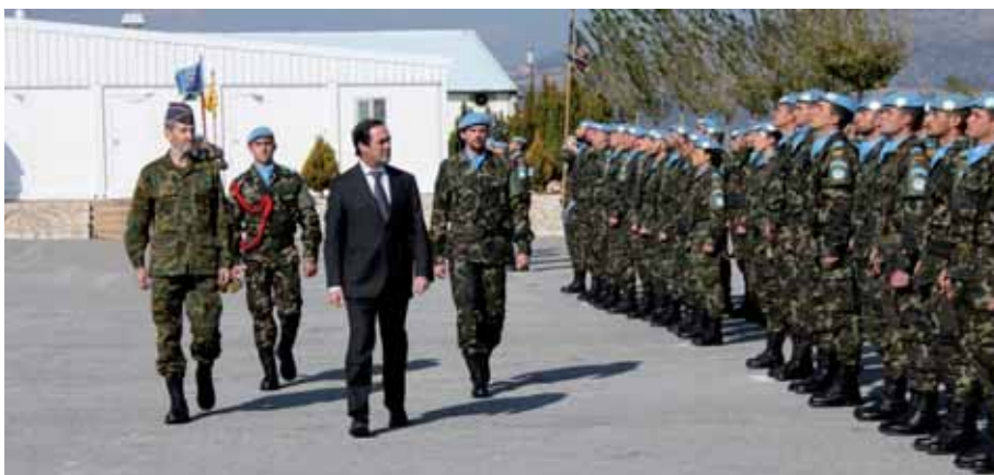
El presidente del Congreso, José Bono, pasa revista a las tropas españolas.

Carme Chacón señaló «los riesgos que corren a diario los militares desplegados en Afganistán, en cada una de las patrullas y misiones que realizan», por lo que insistió en «mantener la alerta máxima».