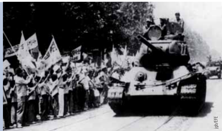
Habitantes de Seúl reciben con banderas a los tanques norcoreanos a su llegada a la capital el 1 de agosto de 1950.

■ 2002.- George Bush, incluye a Corea del Norte en el llamado Eje del mal , y le exige que abandone su programa nuclear.