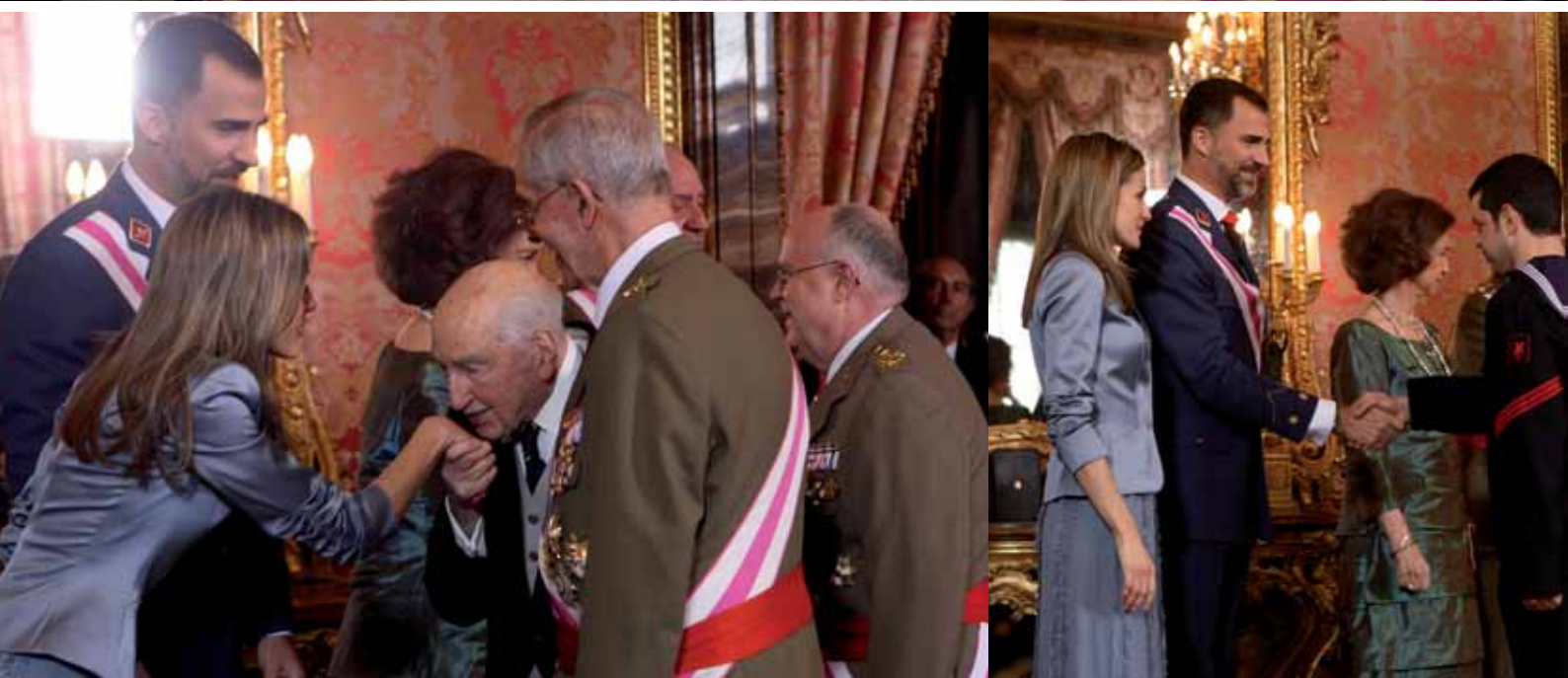
Los reyes y los príncipes de Asturias reciben el saludo de las diferentes autoridades y comisiones en la Saleta Gasparini —sobre estas líneas— la ministra de Defensa, Carme Chacón, —foto de arriba— expuso en su discurso un balance de

una reducción de los secuestros, advirtió que el problema persiste. «Así lo atestiguan las veintiocho naves que están secuestradas en este momento, con más de 650 tripulantes a bordo, dos de ellos españoles, por cuya pronta libertad hacemos votos». Recordó, además que, durante el pasado año, España impulsó la operación EUTM-Somalia , que tiene como objetivo adiestrar en Uganda a las fuerzas de seguridad somalíes.