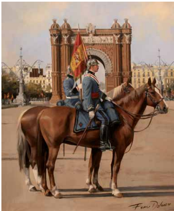
El artista catalán recrea fielmente la historia militar como este cuadro de un brigadier del Montesa en la Barcelona de principios del XX.

Pintar un caballo de manera aislada no es difícil. Incorporarlo al lienzo integrado a su jinete y agrupado con otras figuras humanas y equinas, como sucede con la carga de caballería, es lo verdaderamente complicado.