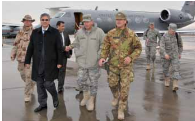
El general David Petraeus a su llegada al aeropuerto de la base de apoyo avanzado de Herat.

Las mejoras y los futuros proyectos de desarrollo del aeropuerto recibieron el visto bueno del jefe de la ISAF, general Petraeus, en el transcurso de una visita, el pasado 21 de enero, en la que estuvo acompañado por el jefe del Mando Regional Oeste