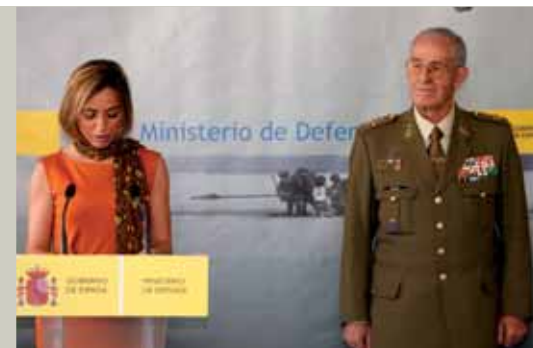
Carme Chacón evoca la trayectoria profesional del general de ejército José Rodrigo, a su lado en el Ministerio de Defensa.

Si el homenaje fue una sorpresa para el general Rodrigo, no lo fue menos el mensaje que la ministra le leyó durante el acto: «Enterado del gesto tan entrañable que te dedica la ministra de Defensa quiero expresarte mi reconocimiento por tu extraordinaria labor al servicio de España y de la corona realizado durante estos 68 años. Juan Carlos rey».