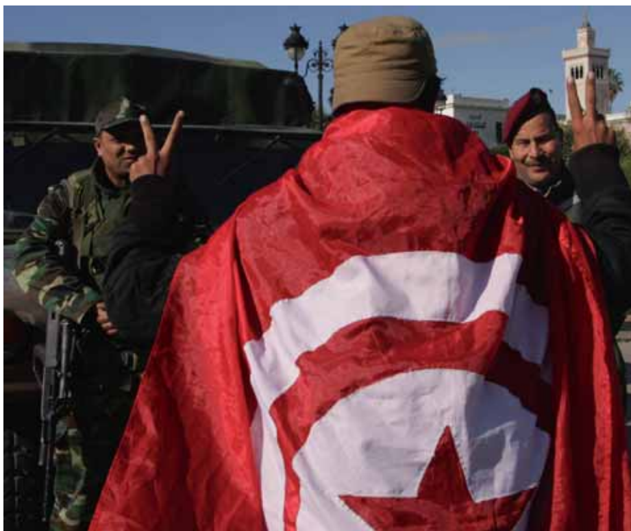
Un hombre con la bandera de Túnez que ha llegado a la capital en una de las decenas de caravanas de apoyo a la revolución hace la seña de victoria ante unos soldados.

Mohamed Bouazizi pasará a la historia de Túnez como un mártir. Pero él jamás imaginó lo que iba a provocar la desesperación que le llevó a quemarse a lo bonzo