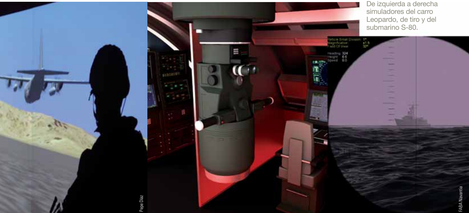
De izquierda a derecha simuladores del carro Leopard, de tiro y del submarino S-80.

En este sentido, el simulador se distingue por la flexibilidad que ofrece al preparador para diseñar los ejercicios más idóneos y crear las condiciones que considere más oportunas para la formación de los soldados. Desde su puesto de control, el instructor puede, por ejemplo, modificar parámetros de la escena — como el tipo de blanco, el modelo balístico o las condiciones atmosféricas reinantes —, añadir movimientos o simular distancias.