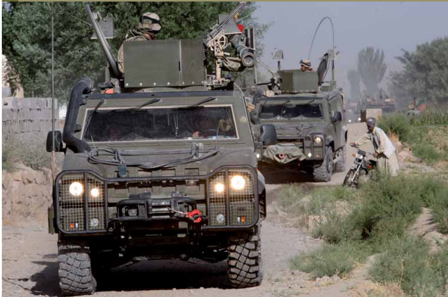
Las patrullas de militares españoles y afganos garantizan la seguridad de las labores de construcción de la Ring Road .