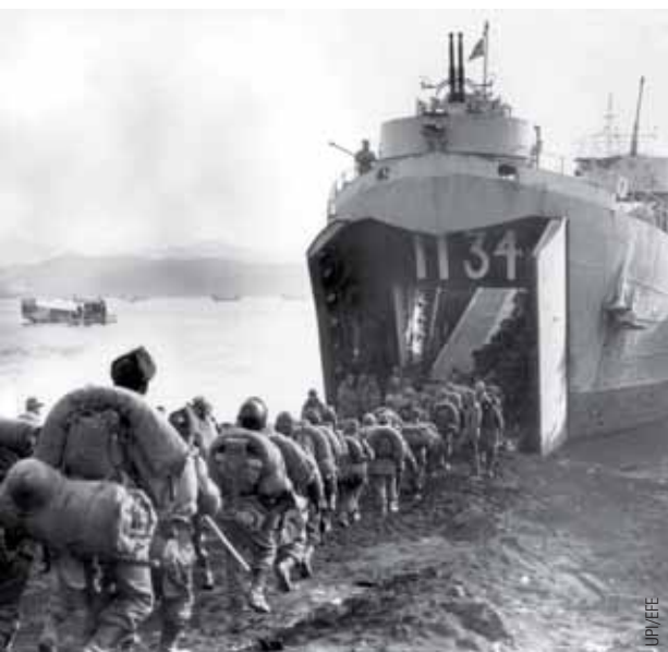
Fuerzas americanas embarcan a finales de 1950 en la playa de Hugnám (Corea del Norte) para su traslado a la base de Pusan en el Sur.

En el año 2009, Corea del Norte interrumpió las negociaciones, después de que el Consejo de Seguridad de la ONU le impusiera sanciones por la prueba nuclear realizada ese mismo año. Por el momento, las conversaciones multilaterales para el desmantelamiento del programa atómico norcoreano están en punto muerto, aunque los países del Sexteto realizan consultas internas para una pronta reanudación. En esta situación, Piongyang, que re-