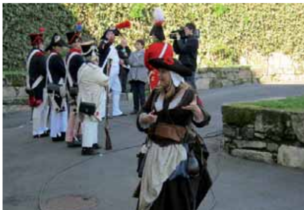
Aficionados a la Historia escenificaron algunos pormenores de la acción contra las tropas napoleónicas.

La institución castrense, asidua colaboradora de la efeméride, ha sido uno de los protagonistas de esta edición. Como es habitual, ha abierto sus puertas para la celebración de algunas de sus actividades, como el Museo Vivo . Propuesta que acerca a los visitantes al desarrollo