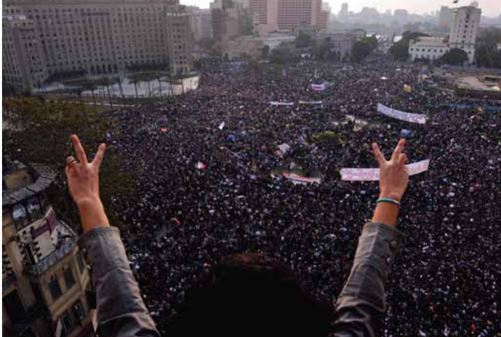
Una mujer hace el signo de la victoria ante cientos de miles de egipcios concentrados en la plaza cariota de Tharir el pasado 2 de febrero.

Además, lo que nadie había previsto es que esa corrupción descarada coincidiera con la emergencia de la crisis, el paro y la