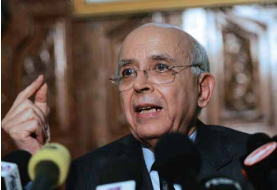
El primer ministro tunecino, Mohamed Ghanuchi, durante la rueda de prensa del día 16 de enero en la que anunció la creación de un Gobierno de conciliación nacional.

A las 9 de la mañana de ese día histórico, los manifestantes se habían concentrado en la sede de la UGTT; desde allí avanzaron hasta la puerta del ministerio de Interior en una masa cada vez más numerosa. En un intento desesperado, se decretó el estado de excepción. Pero sin el Ejército, el presidente estaba perdido. Y lo sabía. Las imágenes de soldados abrazados a los manifestantes, de carros