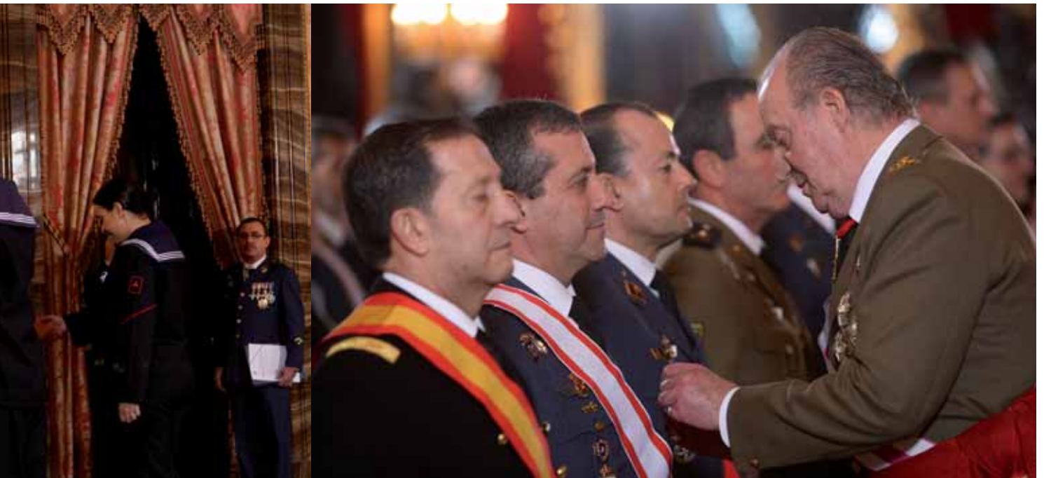
— . Poco después, en el Salón del Trono, el rey impuso condecoraciones a veinte militares y guardias civiles —derecha— y, a continuación, e los aspectos más destacados de 2010 y avanzó los principales proyectos para el nuevo año.

El rey también subrayó lo «mucho que se espera» del nuevo modelo de enseñanza, cuyo objetivo es formar «excelentes militares». La puesta en marcha del nuevo sistema en las academias de suboficiales «dotará del perfil necesario a dichos profesionales que, con su impulso, dan