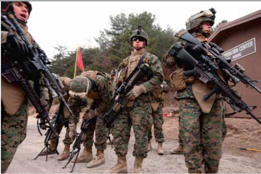
Un comando de soldados estadounidenses y surcoreanos en marzo de 2010 durante una de sus maniobras combinadas-conjuntas que realizan de forma periódica.

lleva 75 aviones de combate y casi 6.000 personas de tripulación, con una cubierta principal de 18.000 metros cuadrados y una eslora de 333 metros. Junto a él participaron dos destructores y dos cruceros norteamericanos, más otros seis destructores, dos fragatas y un submarino surcoreanos. El jefe del Estado Mayor Conjunto norteamericano, Mike Mullen, y su homólogo surcoreano, Han Min-koo, anunciaron en rueda de prensa que las maniobras militares tenían como finalidad desalentar «futuros actos de agresión».