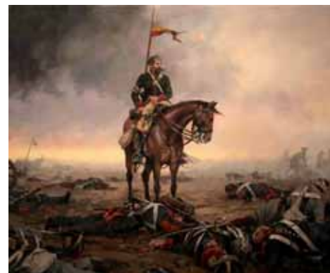
El pintor barcelonés siente especial predilección por la pintura ecuestre. Carga del Regimiento Farnesio en los Castillejos , izquierda. El final de la batalla , arriba.

En este óleo dedicado al Regimiento de Infantería de línea Asturias se puede apreciar cómo Ferrer-Dalmau plasma la guerra en el rostro de los combatientes.