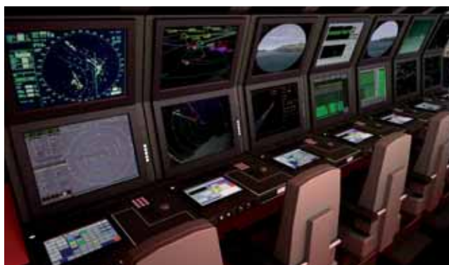
Los pequeños simuladores han dejado paso a los grandes sistemas que integran diferentes capacidades.

Así, por ejemplo, la Asociación Europea de Simulación y Entrenamiento (ETSA) cuenta con el grupo de trabajo «Estándares e Interoperabilidad». El Grupo de Modelado y Simulación de la Alianza tiene por su parte un subgrupo especializado en esta área que ha publicado un perfil de estándares. Además, existen otras organizaciones dedicadas exclusivamente a este tipo de desarro-