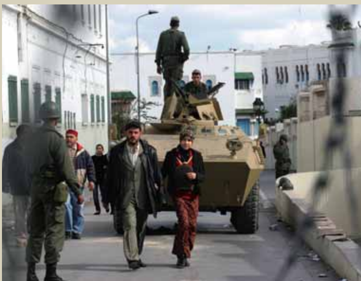
Los ciudadanos han compartido las calles de las ciudades de Túnez con carros de combate con absoluta normalidad y confianza.

Las Fuerzas Armadas tunecinas siempre se han caracterizado por su profesionalidad y su escasa relación con el poder. No formaban parte del séquito de oligarcas que rodeaban al antiguo presidente y han conseguido mantener una clara separación entre el estamento militar y el político. Pero, como suele ocurrir en esos momentos clave que determi-