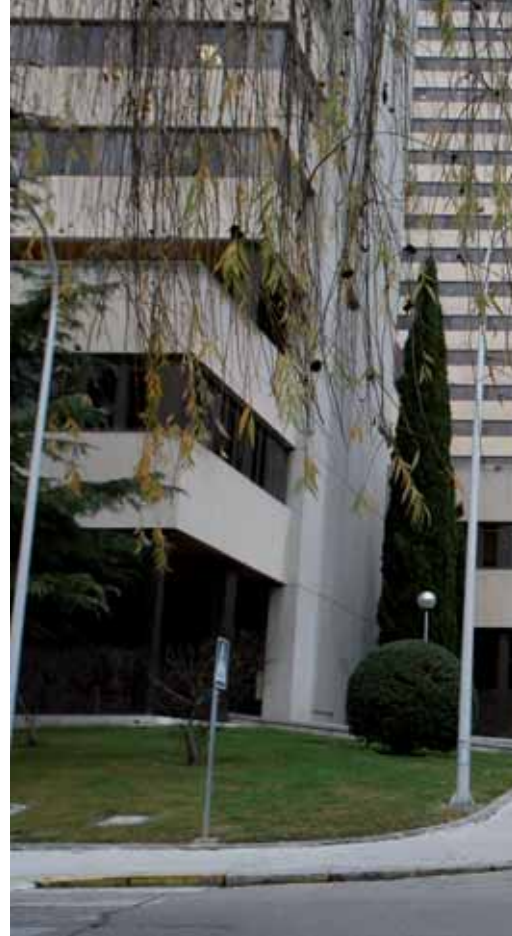
El centro prestará atención a los ciudadanos

Esta última cifra puede parecer reducida «pero es necesario entender que acabamos de incorporarnos a la red