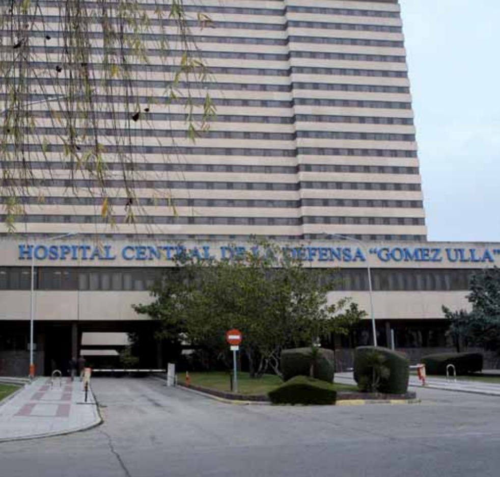
que residen en Puerta Bonita, Los Cármenes, Los Yébenes y Nuestra Señora de Fátima.

do otros hospitales de referencia como el Doce de Octubre o el Clínico acuden al servicio de urgencias del Gómez Ulla porque se encuentra más próximo a sus domicilios. «No podemos negarles la atención que precisan».