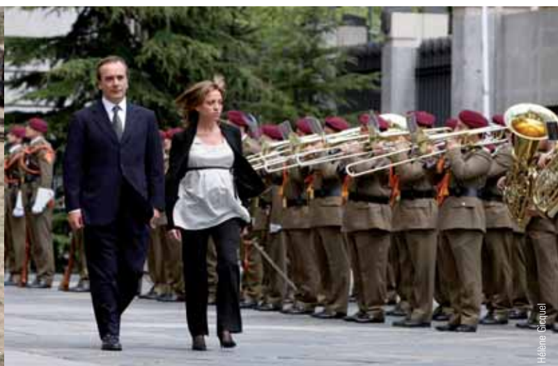
se realiza maniobras; un soldado español en Afganistán, y ceremonia de toma de posesión de la ministra de Defensa, Carme Chacón.

problemas de distinta índole y dificultad. Los cambios organizativos han sido constantes, a un ritmo a veces difícil de seguir y con exigencias personales a veces muy costosas. Los sucesivos planes de redesplicue del Ejército de Tierra son un claro ejemplo. Estos cambios han incidido en la propia organización del Ministerio, en el papel del Estado Mayor de la Defensa y de los Cuarteles Generales de los Ejércitos y de la Armada. Y la creación de la UME es también expresión de las «nuevas» misiones.