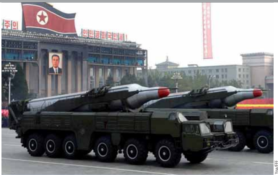
Camiones lanzadores transportan misiles balísticos de medio alcance BM 25 durante un reciente desfile militar celebrado en la capital de Corea del Norte.