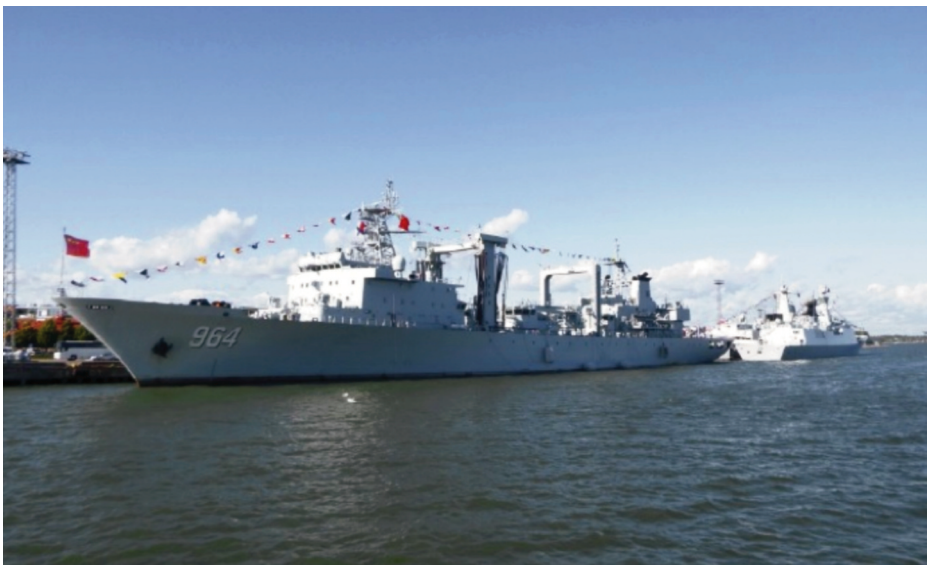
Buques chinos en el Báltico.

Las recientes operaciones BALTOPS- 17 constituyeron la demostración de la determinación de la Alianza frente a las amenazas derivadas de la nueva estrategia rusa en el Báltico con operaciones navales y en tierra, por medio de