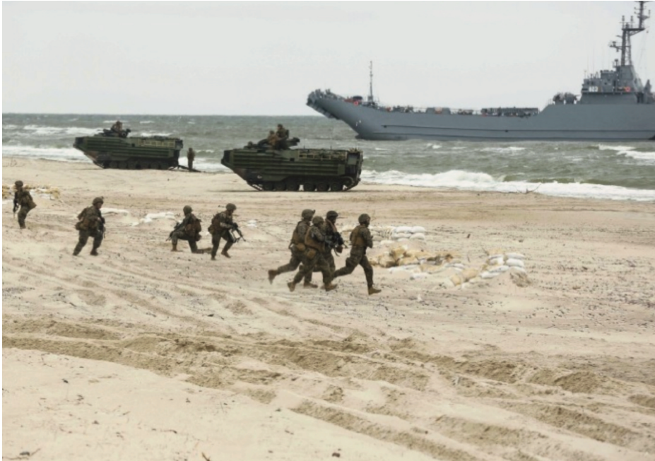
Operaciones de desembarco en las costas de Polonia y Latvia.

La OTAN tiene puesto en el Báltico uno de sus esfuerzos principales para la defensa europea de la región norte, con la misión de asegurar la protección militar de los países que se sienten amenazados, especialmente aquellos que estuvieron en la órbita de la URSS y hoy forman parte de la Alianza Atlántica,