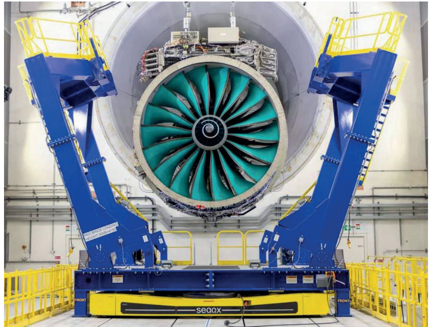
Este es UltraFan, el mayor motor del mundo. https://www.elconfidencial.com/tecnologia/novaceno/2022-12-25/mayor-motor-avion-lis-to-pruebas-rolls-royce_3547197

El procedimiento de manufactura de este motor de nueva generación incluye un proceso de fabricación completamente innovador, ya que utiliza el procedimiento de fabricación de materiales compuestos en 3D