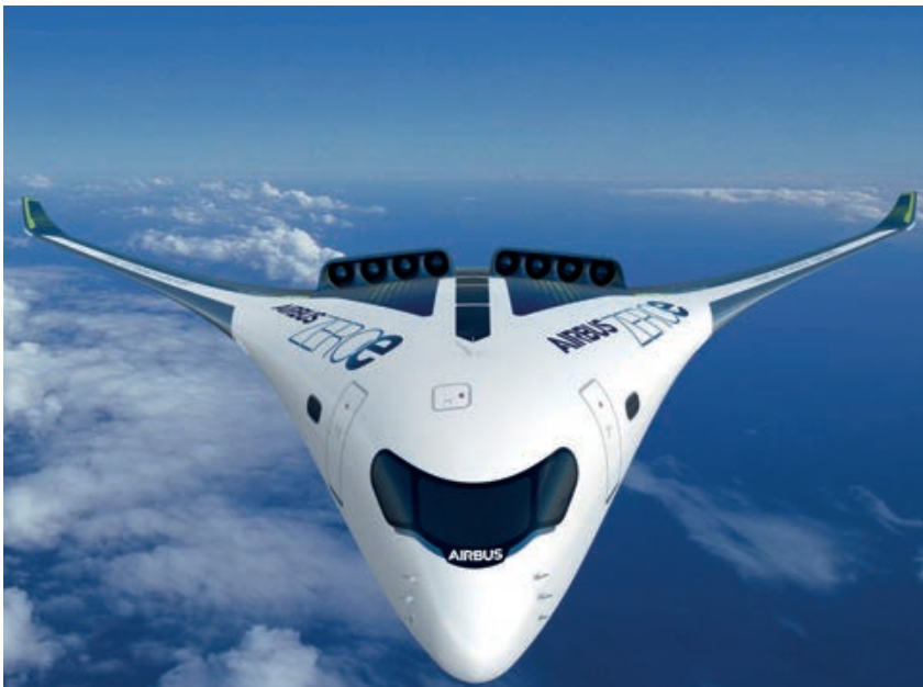
Diseño propulsión Turbofan programa ZEROe. (Imagen: Airbus desvela tres conceptos ZEROe, 2020)