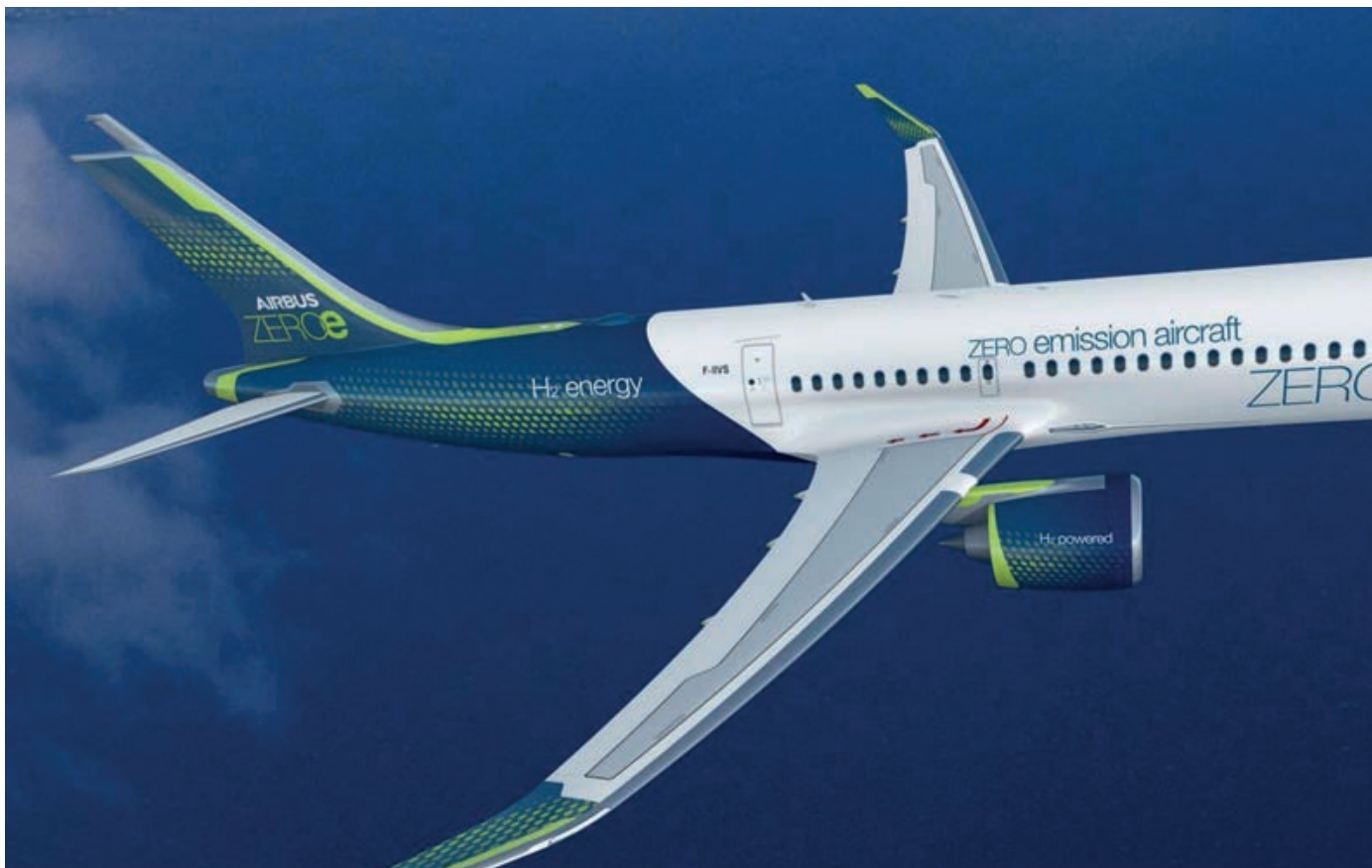
Diseño propulsión Turbofan programa ZEROe. (Imagen: Airbus desvela tres conceptos ZEROe, 2020)

nición teórica para este concepto de acuerdo con la RAE (Real Academia Española) es: «quitar el ácido carbónico a una sustancia». Fruto de esto, la sociedad y, particularmente, el sector aeronáutico y aeroespacial, se han planteado un sinfín de proyectos con el objetivo de reducir la conta-