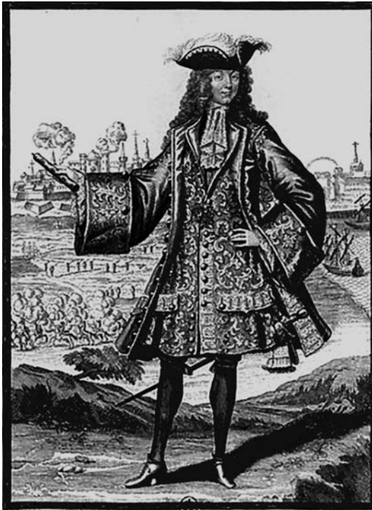
Monsieur de Pointis Chevalier de l'Ordre de St. Louis, et Capitaine d'un vaisseau de Roy, fameux par la prise de Cartagene en Amerique, en l'année de la M. 1697 avec 7000 hommes de guerre, et 10 autres milliers de boucaniers, devant de 15000 Indiens ou habitants; par son commandement par Monsieur de Cassin, son rival maître le 27 May, y trouva 85 pièces de Canon, et en a rapporté la plus leur de plus de dix millions en barres, lingots, monnoies, et autres effets.

Pointis nació en 1645. Su primera acción de guerra consistió en el ataque a Trípoli en 1681. En 1682 participó en los bombardeos contra Argel, y en 1684 contra Génova. En 1690 mandaba un navío y participó en la batalla de Beachy Head (10 de julio de 1690) a las órdenes de Tourville, en la que los franceses derrotaron a la escuadra anglo-holandesa del almirante Arthur Herbert, conde de Torrington.