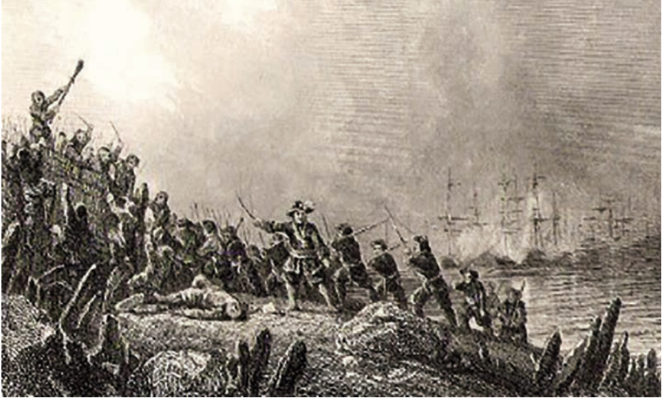
Toma de Cartagena de Indias.

Al orto del 1 de mayo, los franceses estaban perfectamente atrincherados en el arrabal de Getsemaní, aprovechando los sacos terreros abandonados por los defensores. Las baterías francesas reanudaron incansablemente el bombardeo de Cartagena.