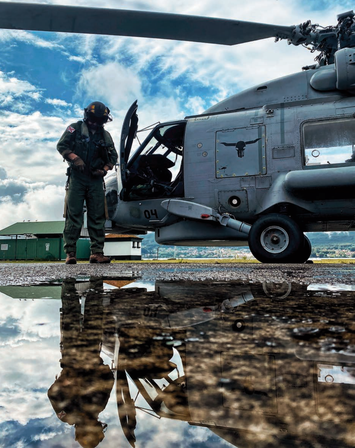
Preparación de vuelo.