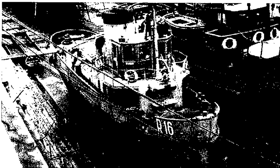
Un R-16 de la serie de seis que construyó para la Marina la Unión Naval de Levante.