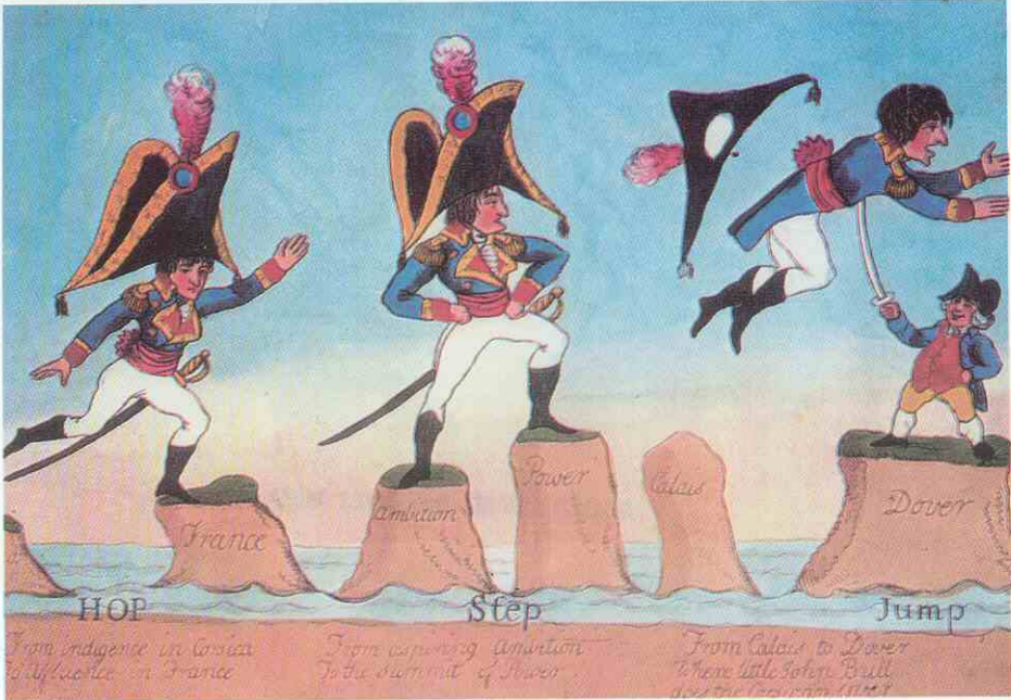
«Brinco, paso y salto».

presencia en el continente. Cuando los aliados continentales de Inglaterra sucumbían, se veía obligada a evacuar su cabeza de playa continental recurriendo exclusivamente a la guerra marítima de carácter preponderantemente defensivo con esporádicas acciones ofensivas en la costa europea o en ultramar. Tres veces antes de 1805 (el año de Trafalgar), el ejército británico hizo acto de presencia en el continente y otras tantas se retiró.