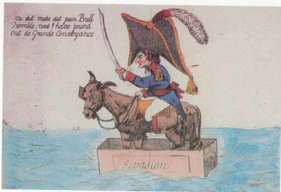
«Mi burro es una caja de cartón».

Este inmenso convoy, escoltado por la escuadra del almirante Bruix, consiguió burlar a la de Nelson en su larga travesía por todo el Mediterráneo, de Tolón a Aboukir.