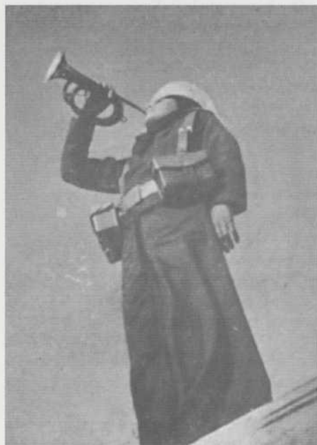
Cometín de órdenes.

la petición que los nuevos propietarios habían formulado en el mes de marzo anterior. En fecha 5 de octubre de 1942 causó baja en la inscripción de Algeciras para pasar a la de Valencia donde, cambiado su primitivo nombre Aline por el de Ruzafa , ocupó el folio 436 de la 2. a lista.