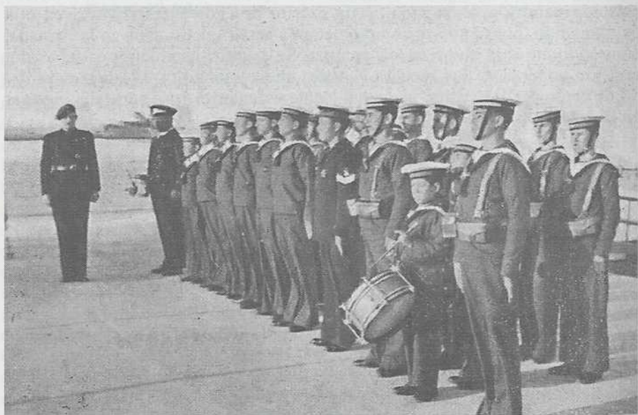
El director de la escuela pasando revista a la dotación.