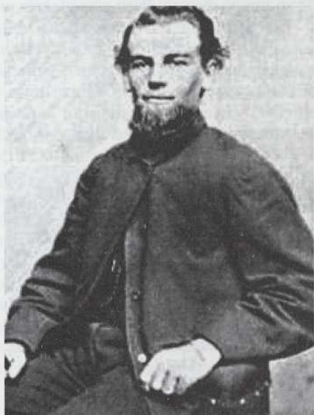
Capitán Benjamin Briggs.

La fecha exacta de salida sigue siendo tema de discusión. Tanto una mayoría de cronistas como los registros de la Atlantic Mutual Insurance Company registran que el Mary Celeste se hizo a la mar el 7 u 8 de noviembre, mientras que la Aduana de Nueva Cork conserva un legajo enmohecido, titulado «Índice de salidas al extranjero», donde cita claramente que con fecha del 4 de noviembre fue despachado el bergantín Mary Celeste con destino a Génova, Italia. Y el 11 de noviembre, otro velero bajó por la canal aprovechando la marea, arregló sus papeles de despacho y se alistó para zarpar de Hook e iniciar una larga travesía a Gibraltar. Izaba bandera británica