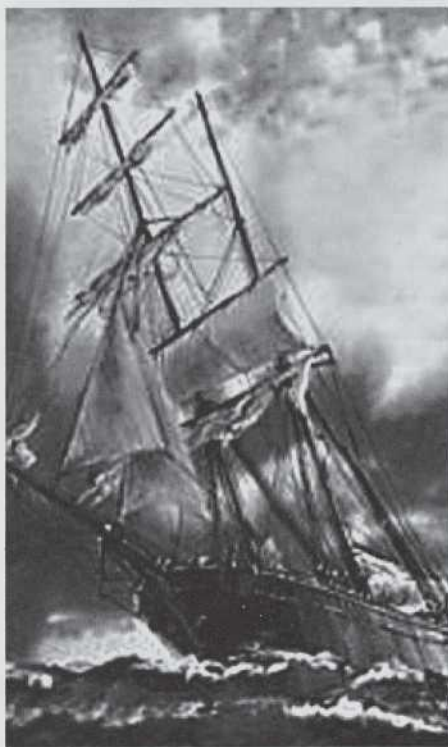
El Amazon , construido en 1860 en Nueva Escocia. Su breve carrera fue desafortunada, más tarde fue desastrosa.

Estaba inscrito en el distrito de Parrsboro, en Nueva Escocia, y hacía once años que navegaba por todos los mares y hacia cualquier puerto donde encontrase carga, cuando salió de Nueva York el 4 de noviembre de 1872 para iniciar su viaje fatal.