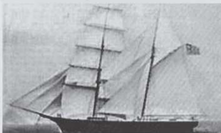
Bergantín goleta Dei Gratia .

Morehouse se acercó más para echar un vistazo e hizo repetidas señales, pero no recibió contestación, y por último hizo una señal de urgencia. Muy cerca ya, Morehouse utilizó su megáfono y gritó: ¡Ah, del Celeste !