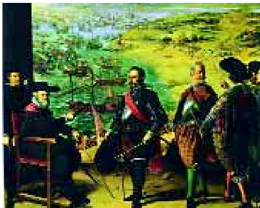
La defensa de Cádiz de los ingleses es uno de los antecedentes del género español de las marinas.

grandes regatas, de los veleros arribando a Málaga, o del Juan Sebastián Elcano surcando los siete mares. Y Garcés, en solitario, rompiendo todos los esquemas con su surrealismo, quedándose con la mar llana, a lo sumo con la marejada, plasmada en distintos tonos de gris; pintando con exquisito humor sargentos y almirantes amostachados, veleros, damas o vírgenes tocadas con gorro de marinero; y jugando siempre con colores vivos, fuertes y contrastados.