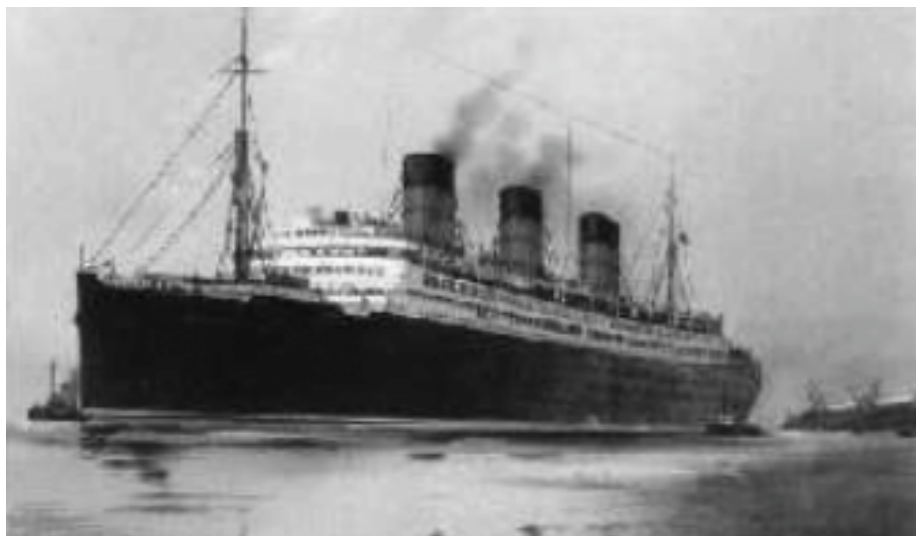
Bello retrato del Queen Mary .