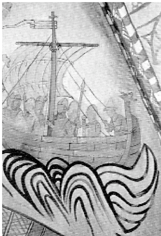
Fresco con la leyenda danesa del rey Olav.

tema para cuadros de Veronés, Andrea Vicentino, Georgia Vasari y Lorenzo Sabatini. Giacomo Guardi (1678-1716) fue muy sensible al ambiente marinerio veneciano, estando su obra muy influenciada por Antonio Canale (1697-1768), fundamentalmente al tratar ambos el tema del viaje del Bucentauro a la ceremonia de los desposorios del Dux con el mar. Salvatore Rosa (1615-1673) es miembro representativo de la escuela napolitana, figurando en su producción varias escenas costeras.