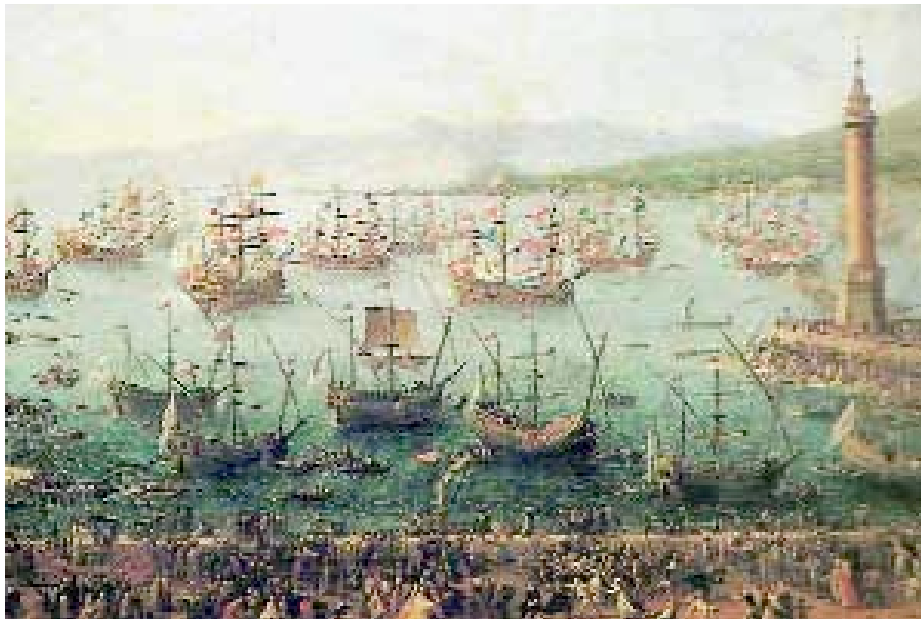
El embarco de Carlos III en Nápoles , de Antonio Joli, es una de las pocas marinas que se exhiben en el Museo del Prado.

Entretanto, Tintoretto, Vicentino y el Veronés pintaron en Italia combates navales. El primero de éstos asumió el encargo de realizar un cuadro sobre Lepanto que no pudo aceptar Tiziano que, sin embargo, pintó uno inspirándose en la rendición de la galera de Alí-Pachá. La gran batalla sirvió también de