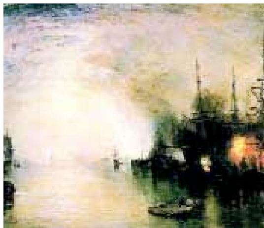
Keelmen , de Turner.

Dentro de la pintura marítima tenemos la de los retratos de barcos, en los que la representación del buque es el elemento que condiciona la obra, mientras que la mar le sirve como soporte. En el retrato predomina la técnica, el dibujo y, como elemento fundamental, la arquitectura naval. Se le ha considerado como un género menor, cuyo objetivo es plasmar una imagen lo más exacta posible de una determinada nave, normalmente como consecuencia del