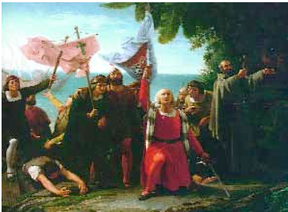
Primer desembarco de Colón, por Dióscoro de la Puebla.

en el arte la pintura acapara la temática marina frente a la escultura, si bien un buque es en sí una obra de arte en sus líneas y sus formas, una escultura viviente.