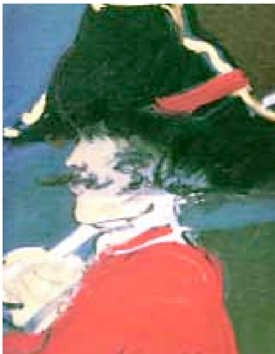
Típico sargento de galeras , de Juan Garcés.

(1612-1687), que dejó el cincel para integrarse en el grupo de artistas del arsenal de Tolón. Pero la gran figura de la especialidad es Claude-Joseph Vernet (1714-1789) que, al igual que Turner, se hizo amarrar en cubierta para apreciar mejor la furia de los elementos. Rossel de Cercy (1765-1829), Théodore Gudin (1802-1880), Louis Garnegaray (1783-1857) y Gustavo Courbet (1819-1877) sobresalen en la nómina de especialistas entre los siglos XVIII y XIX.