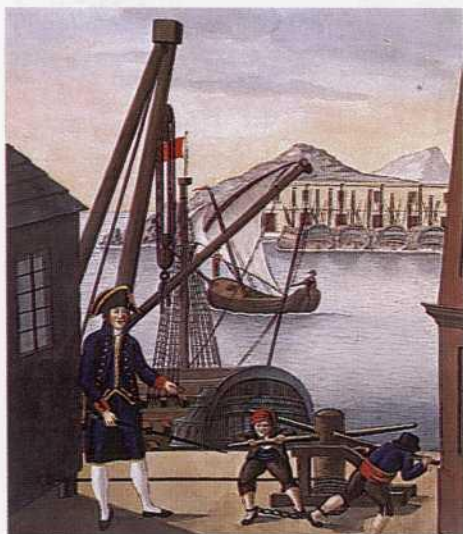
Primer contra maestre y dos forzados.

sin experiencia en la mar. El desastre ya se preveía en las reales provisiones que se adoptaron para armar la escuadra.