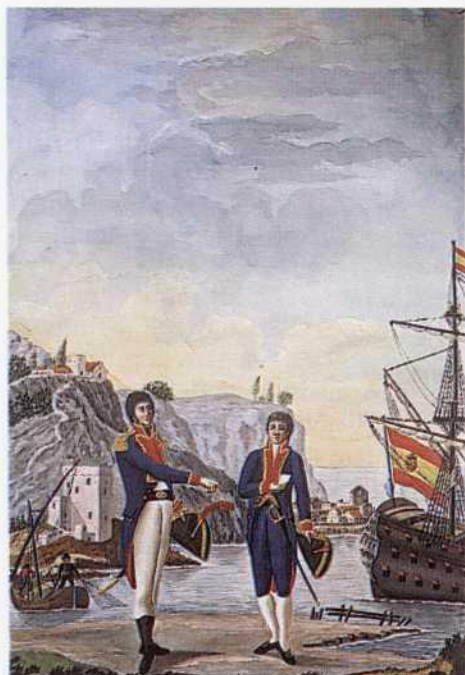
Teniente de fragata del Cuerpo General y guardia marina con uniformes de la Real Orden de 5 de marzo de 1995.

«...solapa, vuelta y solapa encarnado en la casaca, guarnecidos y también la chupa de galón estrecho.»