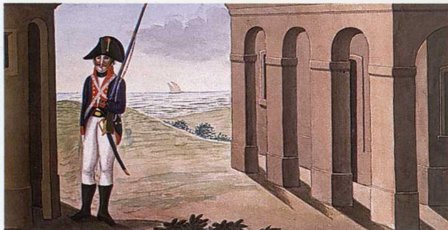
Soldado de Infantería de Marina en tierra.

La descripción de estos uniformes es como las de 5 de marzo de 1785 y 9 de julio de 1802.