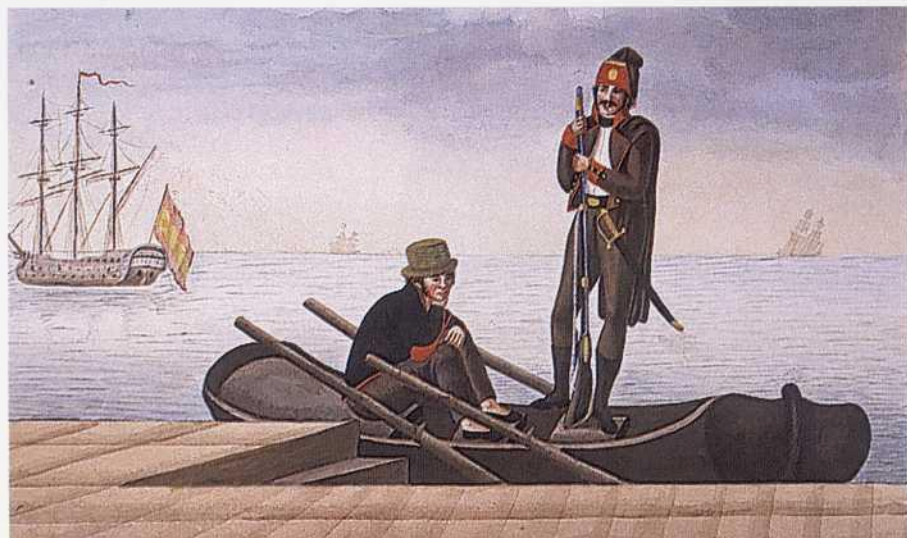
Marinero y soldado de Infantería de Marina embarcados.