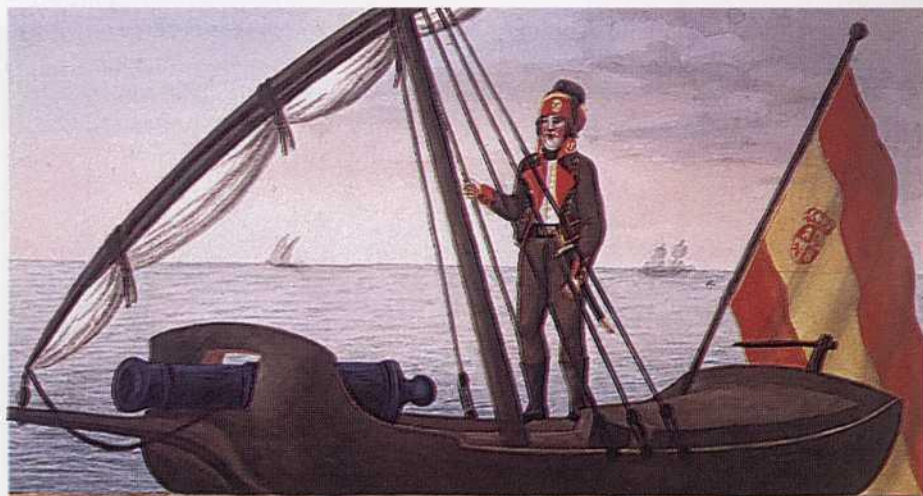
Artillero de Marina embarcado.

«...Su Uniforme: Casaca y solapa azul con vivos, vuelta, cuello y forro encarnado con portezuela azul en la vuelta y tres botones en ella, y en el cuello una ancla y una bomba; chaleco y pantalón blanco (en el Estado Militar de la Armada pone: chaleco blanco y pantalón azul); corbatín y botín corto negro; sable corto; y para a bordo chaqueta y pantalón de paño con forro, cuello y vuelta encarnada, con portezuela parda; chaleco blanco, corbatín negro, botín corto, y gorra con un ancla y dos bombas.»