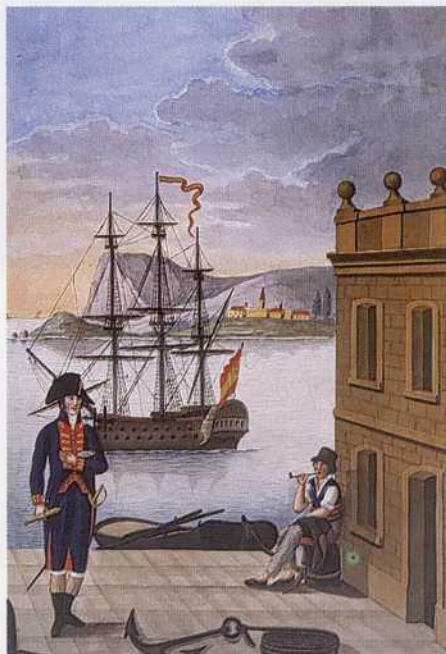
Primer piloto y marinero.

«...Casaca y calzón azul; chupa, vuelta y solapa encarnada, ojal de oro y botón dorado de ancla; distinguiéndose por el número de estos en vueltas, solapas, carteras y faldas las diferentes clases del Cuerpo; llevando los Primeros Pilotos en la solapa, vuelta, cartera y faldones tres ojales de esterilla de oro; los segundos dos ojales de lo mismo; los terceros uno. Los Pilotos prácticos usan chupa y solapa azul.»