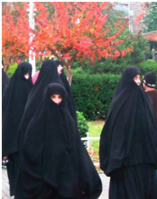
Grupo de mujeres paseando por Estambul.

dos indistintamente en los medios de comunicación, cuando en realidad tienen significados distintos.