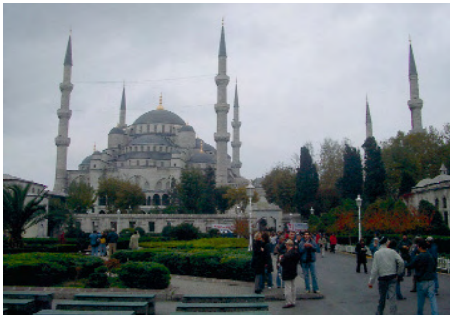
La Mezquita Azul o del sultán Ahmed de Estambul.

Si somos de los que pensamos en el primer grupo de palabras, podremos decir que tenemos cierta idea sobre el tema del artículo. Podemos creer que el islam sólo es una de las tres religiones monoteístas, junto con el cristianismo y el judaísmo. El término islam proviene del árabe al-islām , que significa paz y sumisión a Dios (Alá). La persona que practica el islam se denomina musulmán, que significa sometido a Alá, y no mahometano. Mahoma fue el último de los profetas enviados por Alá y al que reveló el Corán (libro sagrado del islam).