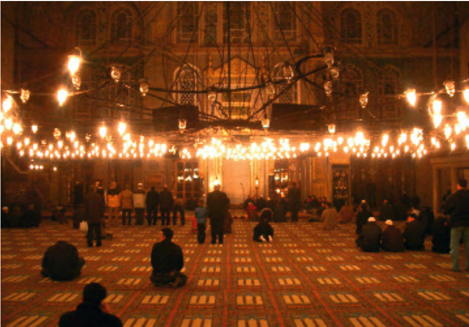
Interior de la Mezquita Azul de Estambul.

Para los musulmanes, Mahoma fue el último de los profetas enviados por Alá, con la misión de recordar y completar los mensajes de sus predecesores, entre los que incluyen a Jesús.