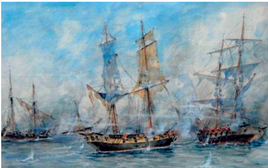
Combate de San Nicolás.

Viendo la necesidad decisiva de dominar esas aguas, la Junta de Buenos Aires decidió, por su parte, improvisar igualmente una fuerza naval, pero ante la carencia de buques y de marinos instruidos recurrió a dar patentes de corso a buques y hombres de cualquier procedencia, dispuestos a luchar por su causa y contra el dominio español, aunque —como comprobará pronto el lector— se trataba mayoritariamente de corsarios franceses, presentes en el Plata desde la guerra anterior, y en ocasiones destacados en la lucha contra las dos sucesivas invasiones inglesas anteriores.