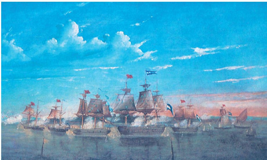
Combate de Martín García.