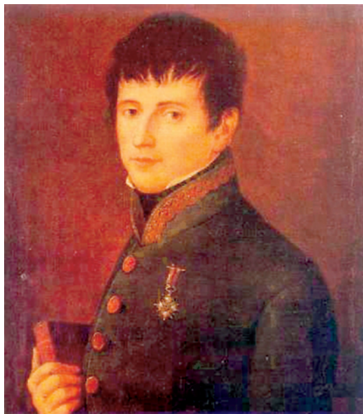
Coronel Rafael Riego.