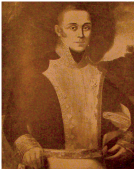
Jacinto Romarate. Anónimo. (Museo Naval. Madrid).

Embarcó a continuación en la corbeta-correo Infante Francisco de Paula , con la que cruzó el Atlántico hasta Puerto Rico, Cartagena de Indias y La Habana, y en viaje posterior hasta Montevideo, donde llegó el 1 de febrero de 1806. Había ascendido a teniente de fragata el 8 de diciembre de 1804, quedando destinado en aquel apostadero.