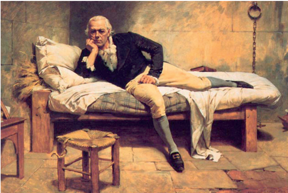
Francisco Miranda en el Penal de Cuatro Torres.

Bolívar, autorizado por Monteverde, se trasladó a Curaçao en la goleta española Jesús, María y José , donde permaneció un corto periodo de tiempo, pasando enseguida a Haití y de allí a Cartagena de Indias (de Poniente, por entonces), en el virreinato de Nueva Granada, cuyo proceso independentista había comenzado el 20 de julio de 1810. En la plaza de los éxitos de don Blas de Lezo compuso el Manifiesto de Cartagena, en el cual incluyó las lessons learned político-militares de la caída de la Primera República de Venezuela y exhortaba a Nueva Granada a no caer en los mismos errores. Enseguida solicitó prestar servicio en las tropas cartageneras y le fue concedido el mando de la guarnición de Barrancas, de 70 hombres. Con ella empezó a forjar su prestigio militar.