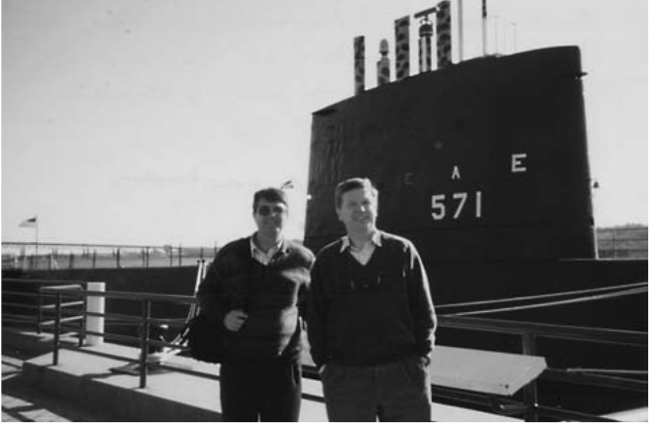
El Nautilus perfectamente conservado como museo flotante en Groton (Connecticut).