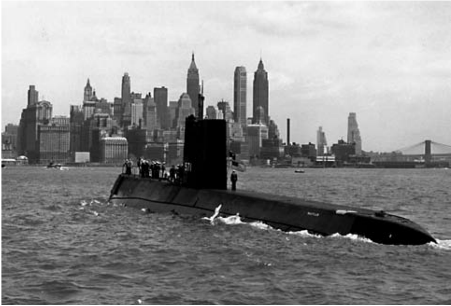
USS Nautilus en Nueva York.

arma estratégica. Esta revolución tecnológica fue posible gracias al almirante Hyman C. Rickover, en aquel entonces oficial de la Marina de los Estados Unidos, que tras estudiar el principio de la energía atómica como fuente de energía llegó a la conclusión de que era posible fabricar un reactor nuclear, alimentado por un pequeño núcleo de uranio enriquecido lo suficientemente pequeño como para impulsar una nave. Tras un comienzo descorazonador al tener que vencer problemas técnicos y burocráticos, consiguió que el Departamento Naval de los Estados Unidos le nombrase jefe de la Comisión de Energía Atómica, con la posibilidad por tanto de llevar a cabo su proyecto.