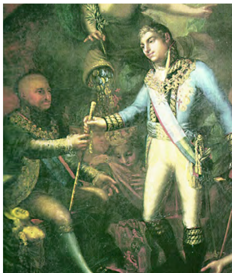
Carlos IV nombra a Manuel Godoy almirante general.

Capitulaciones de Santa Fe, conceden a Cristóbal Colón el título de «Almirante del Mar Océano», con las mismas prerrogativas que los de Castilla «en todas las tierras e islas que descubriese».