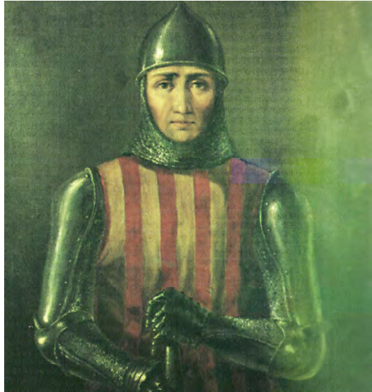
Almirante de Aragón Roger de Lauria.

Al igual que en Castilla, el título finalmente subsistió como honorífico a la muerte de Juan Ramón Folch de Cardona en 1471.