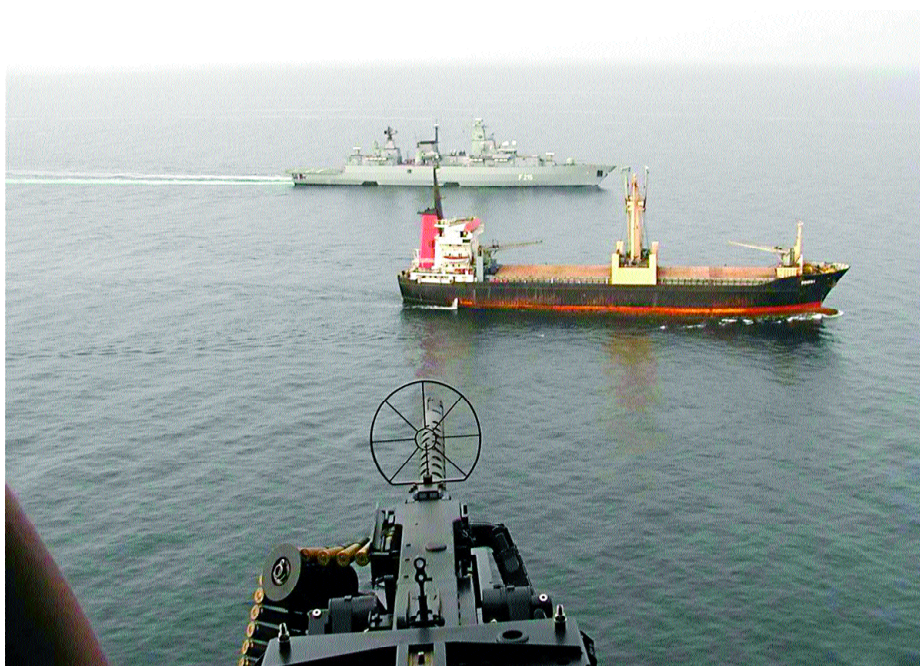
Misión de escolta durante la operación RESOLUTE BEHAVIOUR.

A estos parabienes, por otro lado comunes a todos los que navegan, hay que sumar la sencillez de su estructura, ya que no tiene prácticamente órganos