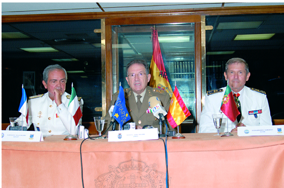
Rueda de prensa tras la ceremonia de Cambio de Mando, septiembre de 2006.