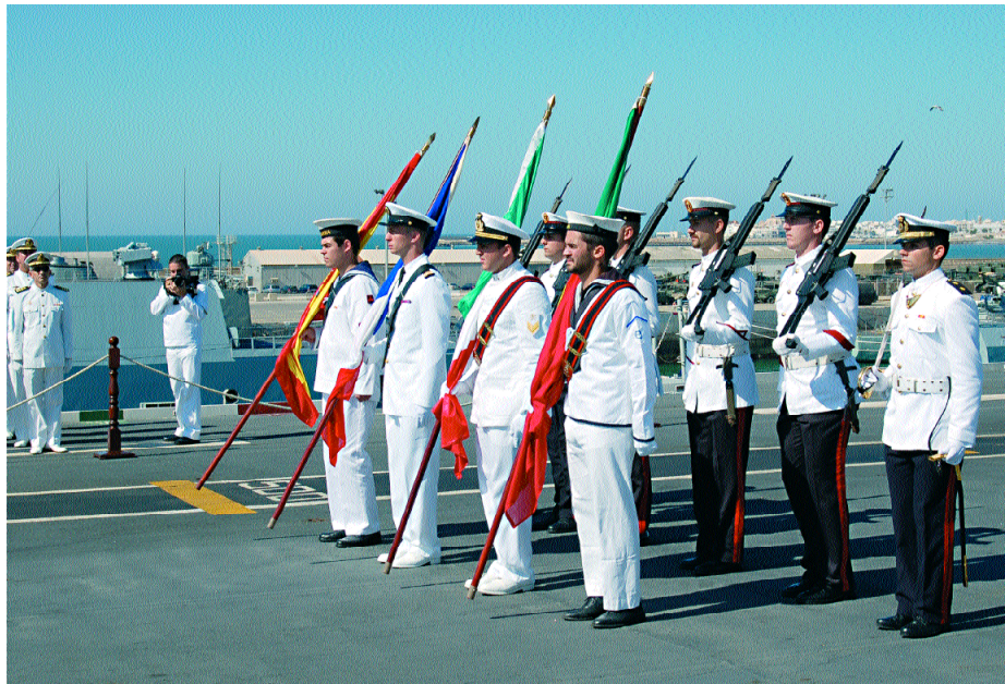
Ceremonia de Cambio de Mando. Banderas de las Naciones..

En lo más alto de la organización, a nivel estratégico, nos encontramos con el Comité Interministerial de Alto Nivel (CIMIN), compuesto por los jefes de Estado Mayor de la Defensa y representantes de los ministerios de Asuntos