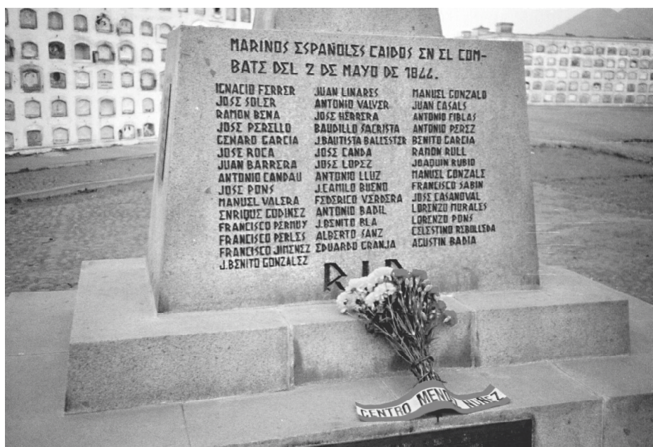
Sepultura en el cementerio de Lima: «Marinos españoles caídos en el combate del 2 de mayo de 1866».