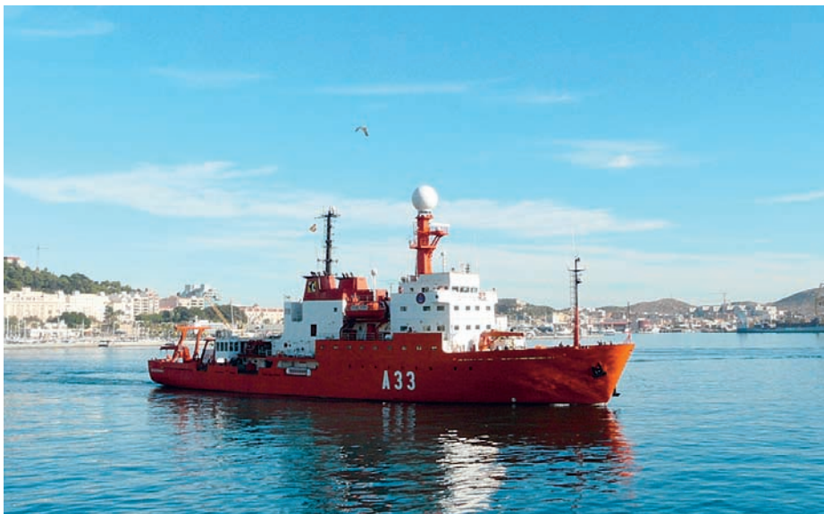
Salida Campaña Antártica 2009-10.