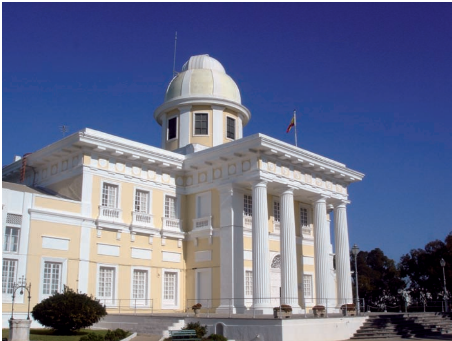
Real Instituto y Observatorio de la Armada.

parte histórica de dicha exposición y contribuirá de forma notable en su catálogo. Respecto al Instituto Hidrográfico de la Marina —como ya se ha mencionado, no hay que olvidar la condición de hidrógrafo de Alejandro Malaspina—, va a participar en los eventos que se organicen en Cádiz durante su despedida institucional, después de su salida de Cartagena el día 11 de diciembre de 2010, y además colaborará en la elaboración de los paneles para la exposición itinerante a bordo del BIO Hespérides que se desplegará en los diferentes puertos.