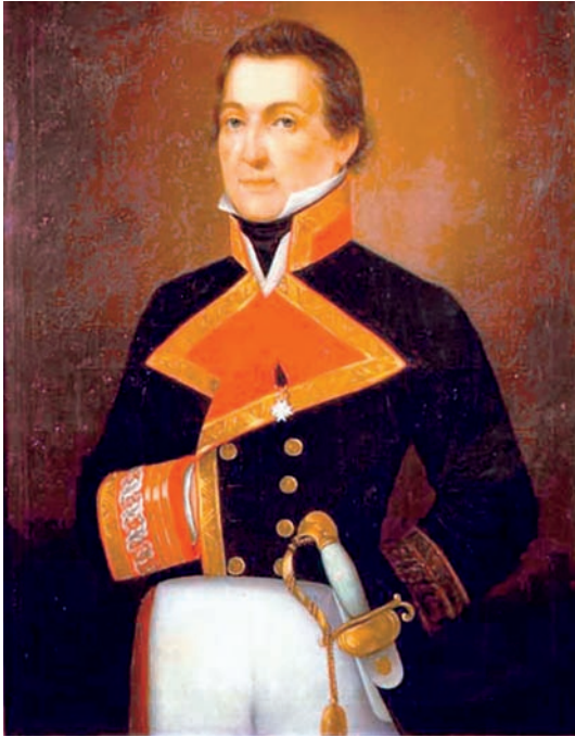
Retrato de Alejandro Malaspina y Melilupi, brigadier de la Real Armada. (Anónimo. Museo Nava).

La Armada siempre había mantenido una clara vocación científica a lo largo de la historia y había sido pionera en muchas investigaciones que se habían desarrollado en tiempos pasados; así, en 1751, casi cuarenta años antes de que Malaspina iniciara su periplo, el insigne marino y científico Jorge Juan y Santacilia, siendo capitán de la Compañía de Guardias Marinas, propuso a don Zenón de Somodevilla y Bengoechea, marqués de la Ensenada y por entonces secretario de Marina, la construcción de un observatorio astronómico en la torre del homenaje del Castillo de la Villa, en Cádiz, sede de la Real Compañía, con el objetivo de inculcar en los guardias marinas la astronomía como fundamento del arte de navegar. Esta propuesta llegó a