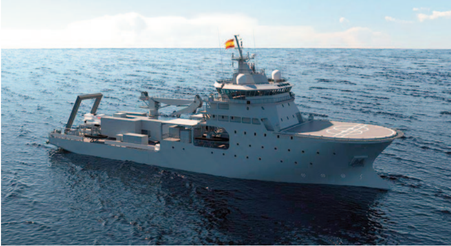
Infografía con el diseño definitivo del BAM IS.

haciéndolos incontrolables, dejando a su vez fuera de control los sistemas sobre los que corren.