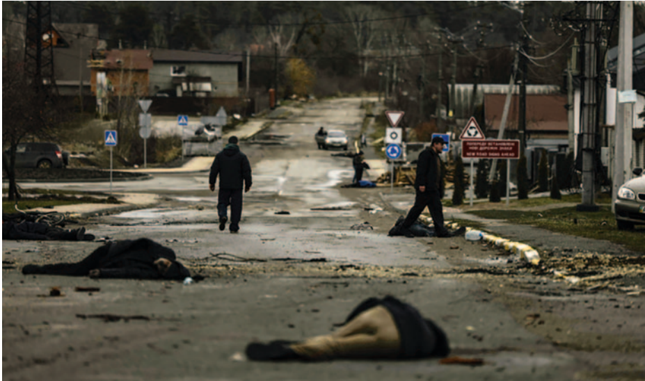
Cadáveres en Bucha. (13)

La actual invasión de Ucrania, pese a su apariencia de guerra clásica militar, es una guerra moderna. La gran diferencia es que se han añadido dos nuevos ámbitos de operación: el cognitivo y el ciberespacial. En su confluencia están las redes sociales, campo de batalla donde se trata de influir en poblaciones implicadas (o no) en la guerra, cuyo apoyo podría favorecer a uno de los bandos.