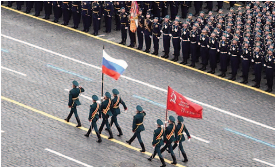
Abanderados Día de la Victoria, 9 de mayo de 2022

Toda esta narrativa basada en remover los sustratos de la Rusia profunda se ha reforzado con una cuidada simbología. La invasión de Ucrania no empezó un día cualquiera, sino el Día del Defensor de la Patria, antes Día del Ejército Rojo de Obreros y Campesinos, que conmemora el alistamiento masivo, en esa misma fecha de 1918, como respuesta a la llamada «¡La patria socialista está