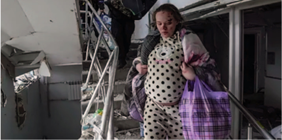
Mujer embarazada herida en Mariúpol.

versiones diferentes y casi consecutivas hacía pensar que los rusos no solo eran responsables, sino que estaban intentando ocultarlo (12).