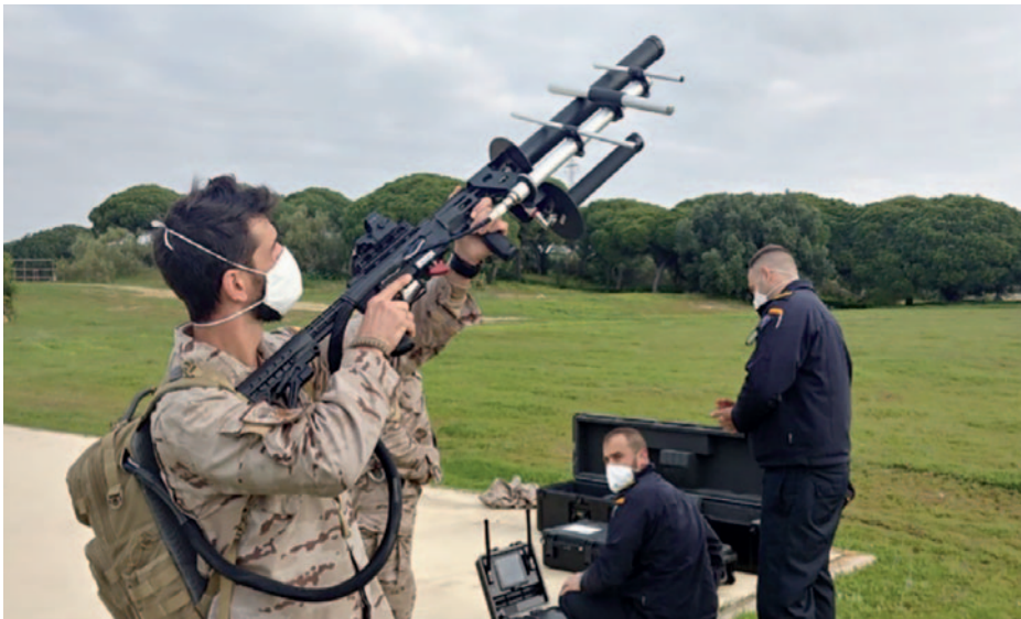
Adiestramiento antidrones.

Para dar a conocer el adiestramiento de las unidades de la Flota en sistemas Contra-UAS nada mejor que describir el escenario de un día de salida a la mar bajo amenaza asimétrica de un buque de la Armada durante el período de calificación operativa (CALOP).