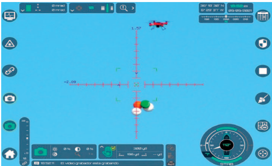
Ejercicio de adiestramiento antidrones durante la calificación operativa del Juan Carlos I.

Esta tecnología ha sido aprovechada por actores estatales y no estatales para emplearla con diversos fines, que van desde la inteligencia, la vigilancia y el reconocimiento hasta su uso como vectores de ataque portando explosivos, municiones, etc. En este sentido, tenemos muchos ejemplos recientes en los conflictos de Siria, Mali, Yemen e Irak.