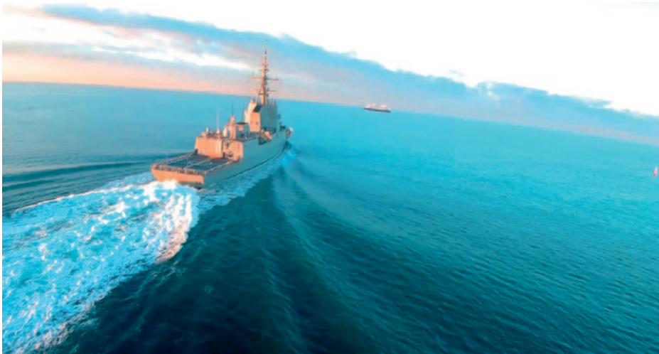
Imagen tomada por un dron en perfil de ataque durante la calificación operativa de la fragata Blas de Lezo .