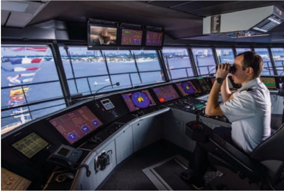
Oficial de guardia en el puente de navegación de un buque mercante, controlando el tráfico marítimo y la seguridad de la navegación.

civil o mercante internacional podrían ser, entre otros: el puente de mando y control del buque, los sistemas de manipulación y gestión de la carga, de propulsión y gestión de las máquinas y de control de suministro eléctrico, de vigilancia y control de acceso restringido, de servicio a los pasajeros y de organización de los mismos, las redes públicas de internet para los pasajeros, los sistemas administrativos y de bienestar de la tripulación y los de telecomunicaciones, así como otros equipos de comunicaciones radio.