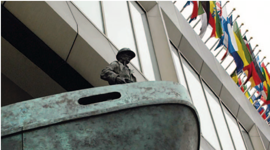
Sede de la OMI en Londres.

La Organización Marítima Internacional (OMI) ha reconocido desde hace ya varios años la necesidad urgente de crear una cultura de seguridad y protección del transporte marítimo frente a la amenaza real de los riesgos cibernéticos, y ha tomado en consideración la importancia de elevar el nivel de concienciación sobre las amenazas y las vulnerabilidades conexas con los riesgos cibernéticos. Asimismo, también reconoce que la industria marítima en su totalidad, así como las administraciones públicas y las autoridades de los Estados, deberían agilizar el trabajo necesario para salvaguardar el transporte marítimo ante las amenazas y vulnerabilidades cibernéticas actuales y