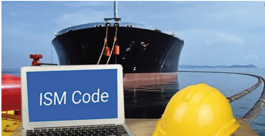
International Safety Management (ISM Code). Código Internacional de la gestión operacional del buque y la empresa naviera.

La OMI afirma que todo sistema de gestión de la seguridad aprobado por la correspondiente administración marítima de Estados de abanderamiento de los buques debería tener en cuenta la gestión de los riesgos cibernéticos, de conformidad con los objetivos y prescripciones del Código ISM, y alienta a las administraciones a garantizar que los riesgos cibernéticos se aborden debidamente en los sistemas de gestión de la seguridad a más tardar en la primera verificación anual del Documento de Cumplimiento (DoC) de la compañía después del 1 de enero de 2021.