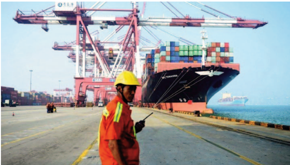
Buque de carga general tipo portacontenedor realizando operaciones de carga/descarga en una terminal portuaria.

Para que la gestión de los riesgos cibernéticos sea eficaz, también se deberían considerar las repercusiones que tienen en la seguridad y en la protección la manifestación o el aprovechamiento de la vulnerabilidad de los sistemas de tecnología de la información. La causa podría ser la conexión indebida a sistemas