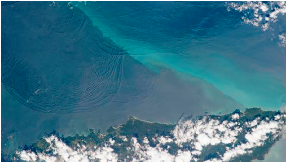
Ola submarina vista desde un satélite de observación.

Kursk el 12 de agosto de 2000 no pudo ser la implosión interna por exceso de presión, pues fue localizado a tan solo 110 metros de sonda y su casco podía aguantar hasta la cota de 1.000 m. Cuando por fin la empresa holandesa Mammoet, utilizando su grúa instalada en el pontón Gigante 4 , pudo izar el submarino y depositarlo en el dique flotante PD-50 , se determinó que la causa del incidente había sido la explosión de un torpedo experimental propulsado por HTP, peróxido de hidrógeno, que hizo que explotara por simpatía el resto de los torpedos estibados en la proa, creando una gran onda expansiva que produjo la gran abertura por la que se inundó súbitamente todo el Kursk .