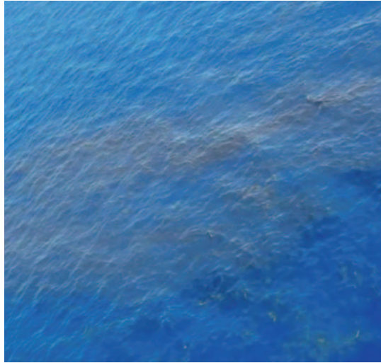
Manchas de combustible producidas por el submarino Nanggala el día 22 de abril.

haber precipitado al submarino por debajo de los 500 metros de cota, ya que en el estrecho de Lombok, entre las islas de Bali y Lombok, se forman estas olas submarinas causadas por fuertes corrientes de marea, un fondo oceánico agitado y el intercambio de aguas de diferente intensidad en canales poco profundos, que se producen cada 14 días, imperceptibles en la superficie pero que podrían alcanzar grandes dimensiones. Este fenómeno se puede comparar con las ondas de las mareas y las capas de fuertes corrientes de diferente intensidad en el estrecho de Gibraltar provenientes del Mediterráneo y del