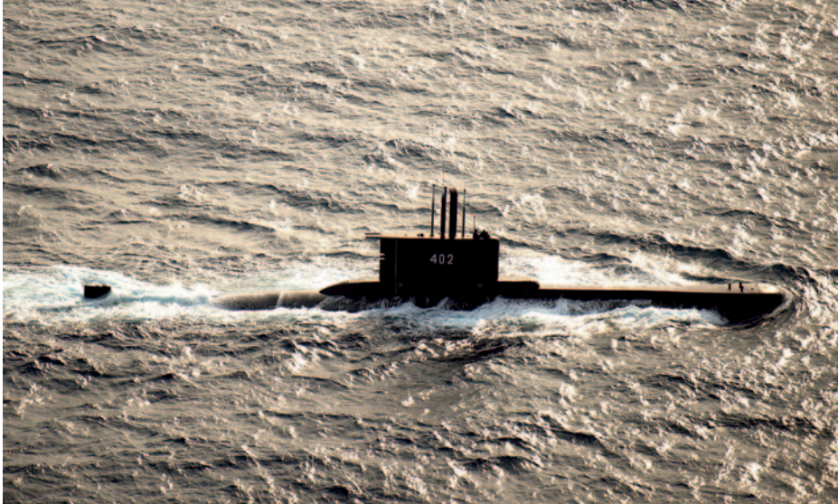
KRI Nanggala (S-402).

primero de la serie construido en 1971; el San Luis argentino, entregado en 1974, y los turcos Atilay y Saldıray de 1976 y 1977, lo que da una muestra de su longevidad.