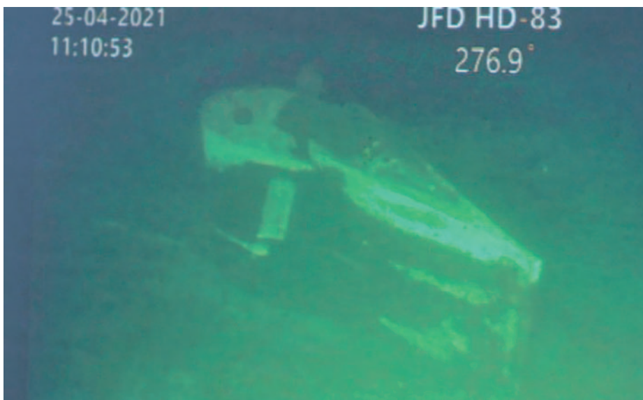
Silueta de la vela del Nanggala a 838 metros de profundidad.

Desgraciadamente ninguno de los medios disponibles en la zona para el salvamento del Nanggala llegaría a ser utilizado, pues el sábado 24 de abril llegó la noticia de que el sonar de barrido lateral y de escáner del buque hidrográfico indonesio Rigel habían descubierto la silueta del submarino en el fondo del mar de Bali, a una profundidad de 800 metros y a 1.500 de la situación donde hizo inmersión, tras comprobar las variaciones del campo magnético que le había proporcionado su magnetómetro. El siguiente paso fue enviar el minisubmarino del buque de salvamento MV Swift Rescue , que ya se encontraba en la zona del hundimiento. Tres horas más tarde, se podían ver las fotografías obtenidas a 838 metros de profundidad, en las que se apreciaba al S-402 seccionado en tres trozos, correspondientes a la proa, el centro con la vela y la popa, así como grietas en el casco resistente, que había cedido debido a la sobrepresión a que había sido sometido al sobrepasar la cota de colapso de 500 metros. El brazo articulado del submarino del MV Swift Rescue pudo además recuperar algunos objetos, entre los que se encontraban varias alfombrillas para rezar —no olvidemos que la dotación era musulmana—, una botella con aceite para engrasar el periscopio, una herramienta para alinear torpedos, tuberías surcoreanas de la última gran carena, un hidrófono y un traje de escape libre Mk-11, lo que indicaba que la dotación se dio cuenta de que el