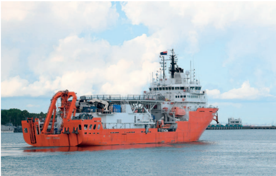
MV Swift Rescue , buque de salvamento de Singapur.

Hasta un total de 21 buques de la Marina indonesia —incluyendo a los cuatro submarinos restantes, con el novísimo Alugoro (S-405), entregado en marzo— se movilizaron en las siguientes 24 horas para intentar localizar al submarino desaparecido, al tiempo que se cursaban peticiones de ayuda a marinas del Sudeste Asiático —Singapur, Malasia e India— y de Estados Unidos y Australia. Singapur envió el buque de salvamento y rescate submarino MV Swift Rescue , que además contaba con un minisubmarino autónomo capaz de alcanzar la cota de la zona de desaparición del Nanggala , superior a 800 metros según la sonda estimada de la carta náutica. Este buque llegaría al lugar de búsqueda el 23 de abril, prácticamente al mismo tiempo que un