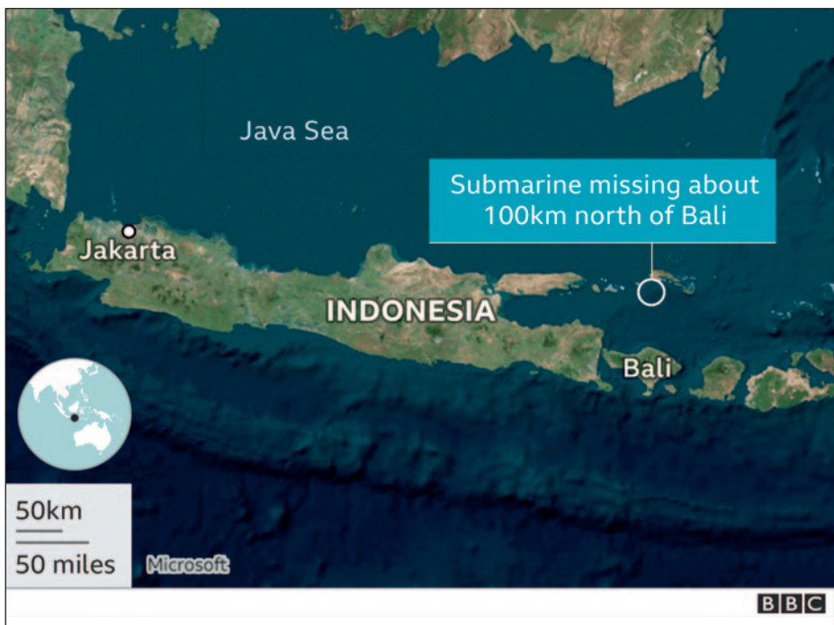
Posición del submarino hundido en la carta de la zona.

La recuperación de un submarino hundido siempre es el objetivo de la nación y de la marina que lo han perdido, así como un vehemente deseo de los