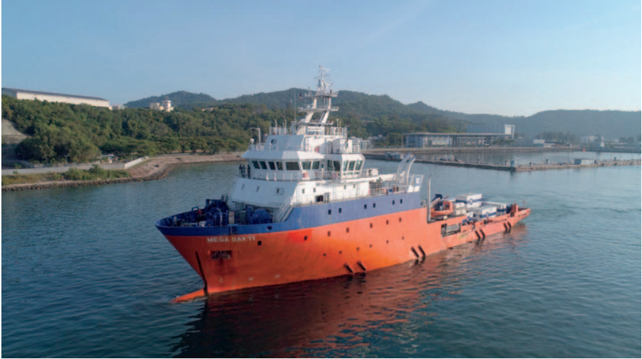
MV Mega Bakti , buque de salvamento malayo.

familiares por recuperar los cuerpos de sus seres queridos; pero la dificultad aumenta exponencialmente dependiendo de la profundidad a la que se encuentre el casco hundido. En este caso, reflotar al Nanggala a 838 metros de sonda implicaba unos medios que la Marina indonesia no poseía.