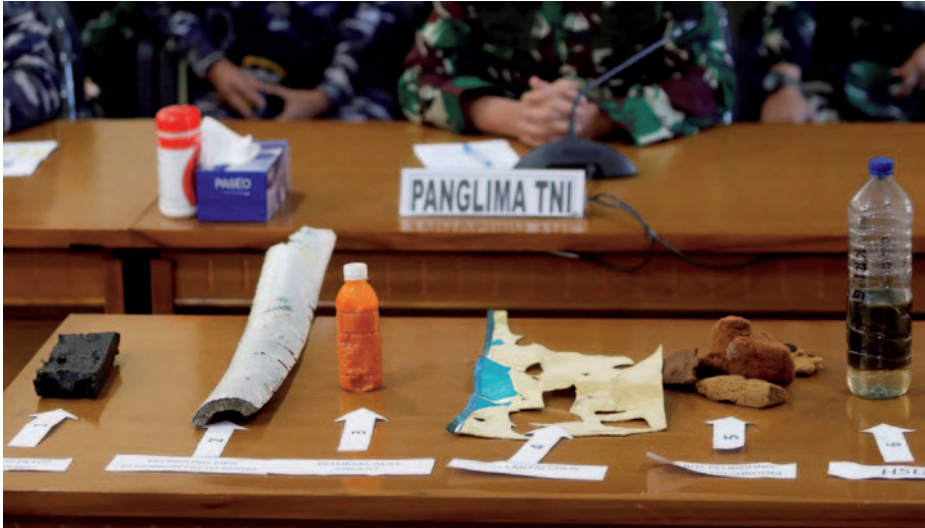
Objetos recuperados del Nanggala .

submarino se hundía, pues este traje se guarda en una caja. Las fotos del pecio a 838 metros de profundidad y los objetos recuperados provocaron una conferencia inmediata con los MCS del jefe del Estado Mayor General, mariscal jefe del Aire Hadi Tjahjanto, para comunicar oficialmente el domingo día 25 la pérdida total del submarino Nanggala y la muerte de las 53 personas que iban a bordo.