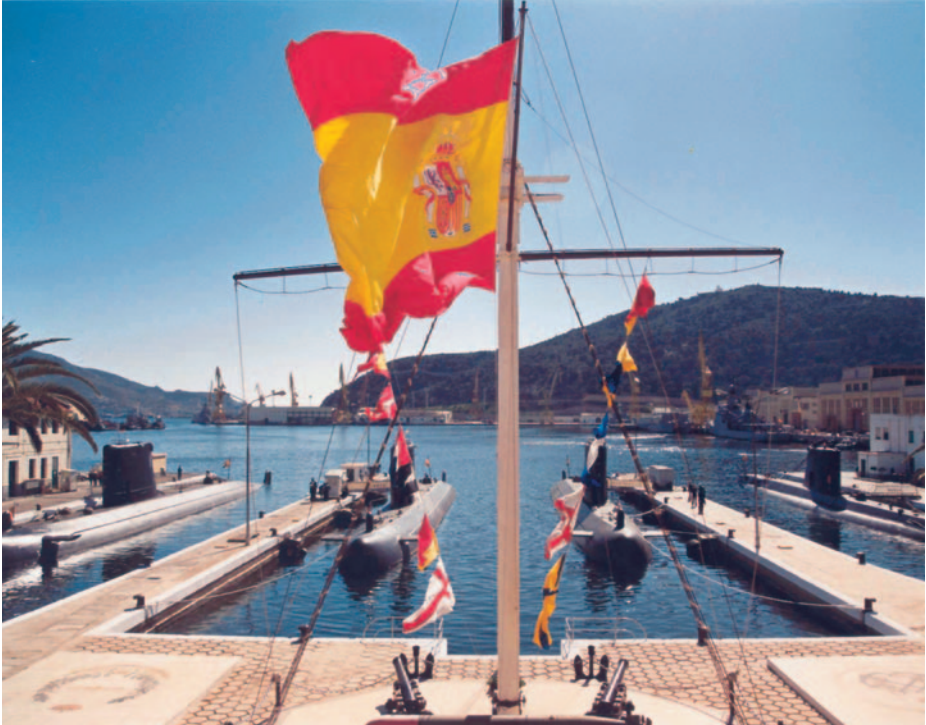
Los cuatro S-70 atracados en su base en el Arsenal de Cartagena.

encima del Siroco cuando este se encontraba a 50 metros de profundidad realizando la preceptiva exploración para subir a cota periscópica, pero el sonarista clasificó al destructor como «mercante turbinas alejándose, el resto libre». Efectivamente el destructor se alejaba, pero a un par de millas cayó 180° de rumbo, poniendo la proa hacia la posición del Siroco , que por supuesto desconocía, con su sonar apagado, con lo que el bulbo de proa enmascaraba las hélices y el submarino no lo oyó. En esta ocasión actuaron conjuntamente la Virgen del Carmen, por el Valdés , que solo sufrió una pequeña vía de agua en la proa producida por el periscopio, y la del Pilar, patrona de los submarinistas, que hizo que el destructor destrozase la vela con los mástiles y el periscopio, pero que respetase el casco resistente.