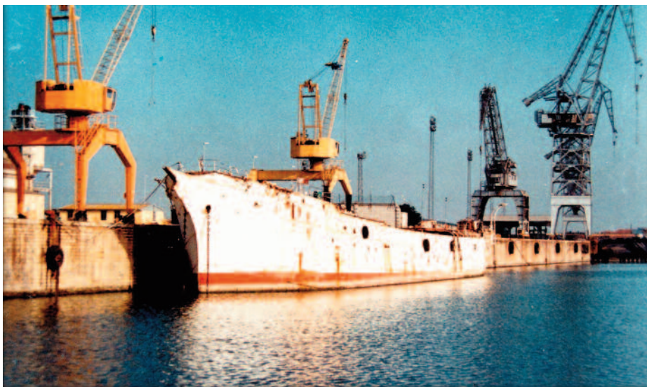
El Galatea en Sevilla, mayo 1993

Sin financiación, con ninguna idea cerrada sobre su uso y sin ni siquiera haber acordado su ubicación (39), el Patronato buscó otras fórmulas para salvar al Galatea . Ya lo decía el propio presidente de la Diputación de Sevilla, Manuel del Valle, antes de que el buque llegara: «No basta decir que sí; hay que tener voluntad de hacer aportaciones concretas» (40).