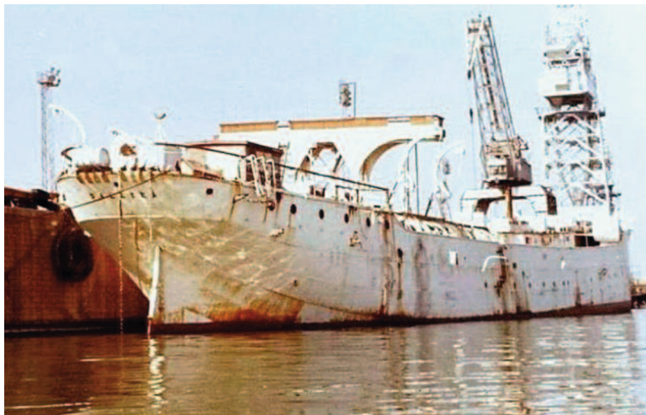
Vista de popa del Galatea atracado en la parte del muelle de la Esclusa correspondiente de Astilleros de Sevilla a su llegada a la capital.

«El estado del buque es francamente deficiente; tengamos en cuenta que, aunque fue reparado hace año y medio, los remaches en un importante porcentaje no están en condiciones... Dada la importante cantidad de grietas y perforaciones que encontramos, se puede temer la posibilidad de que la fatiga del material conduzca a fracturas de tipo frágil, que se ocasionarían con cargas bastante por debajo del límite elástico» (16).