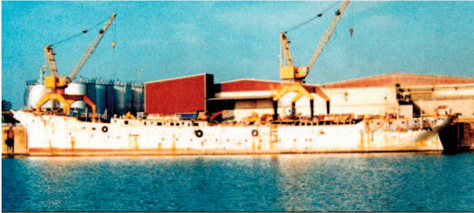
El Galatea en Sevilla 1993

Vista del costado de babor del Galatea atracado en las instalaciones de Sevirtrade (muelle de la Esclusa) antes de partir a Escocia.