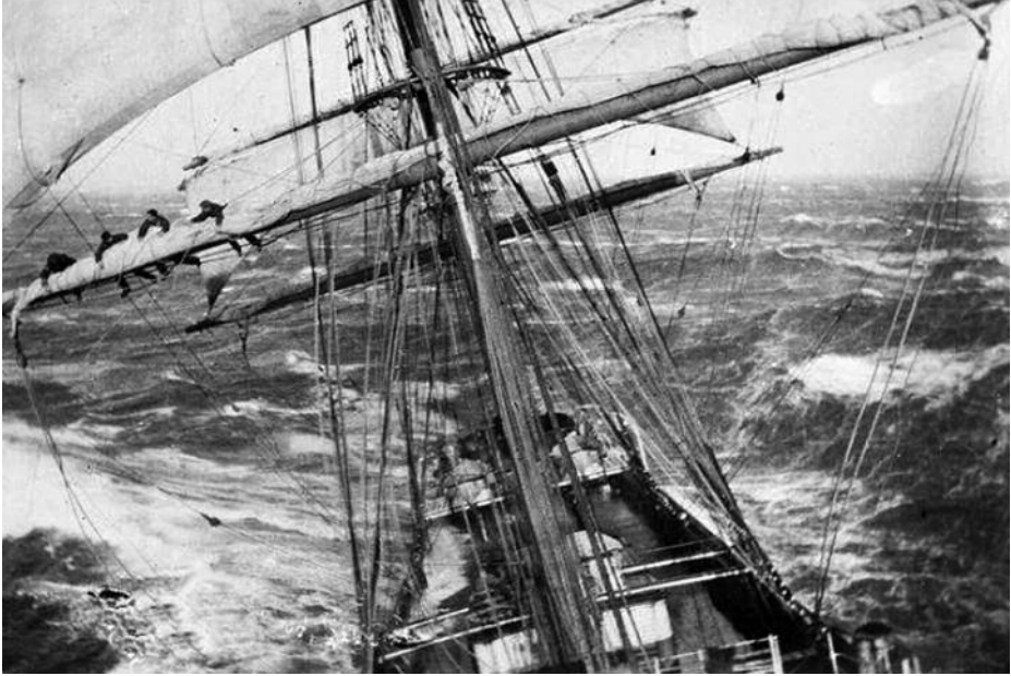
Navegación a bordo del Galatea . (Foto: www.pinterest.es ).

supervivientes del buque escuela alemán Pamir (1957), los temporales corridos en el Atlántico y en el mar del Norte (1946 y 1954), los viajes como embajador especial de España a puertos de América del Sur, Europa y África y, sobre todo, la formación de especialistas de nuestra Armada y hasta de otras marinas hispanoamericanas.