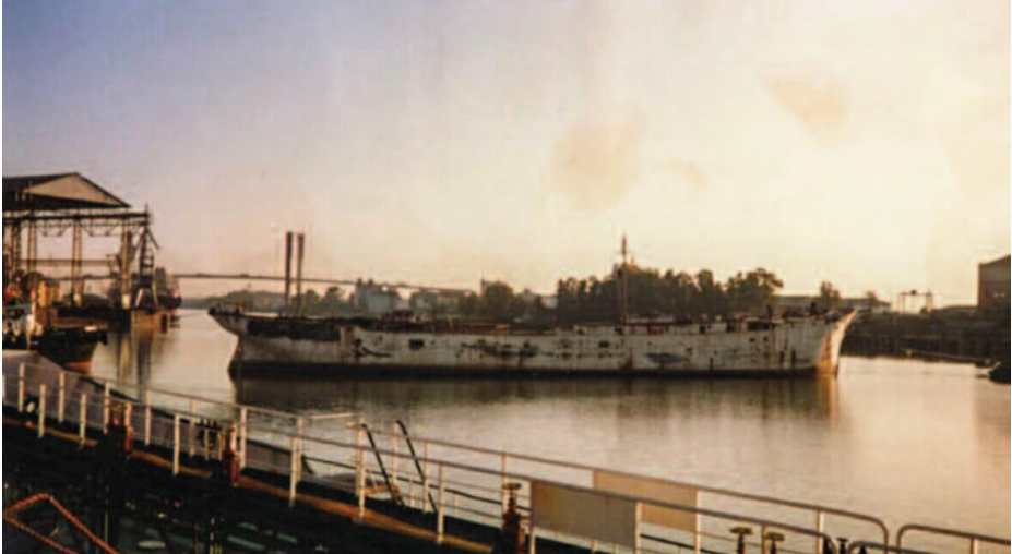
Maniobra de salida del Galatea de las instalaciones de Sevirtrade, en el Puerto de Sevilla. (Foto: https://www.youtube.com/watch?v=MRDYr45yDhM ).

Ante la imposibilidad del Patronato de San Telmo de conseguir las cantidades necesarias, el 16 de enero de 1990 dicha institución acabó rescindiendo el contrato con el Estado, volviendo así a manos del Ministerio de Defensa. El Galatea en Sevilla pasó de la gloria de las páginas de los periódicos al purgatorio del carpetazo.