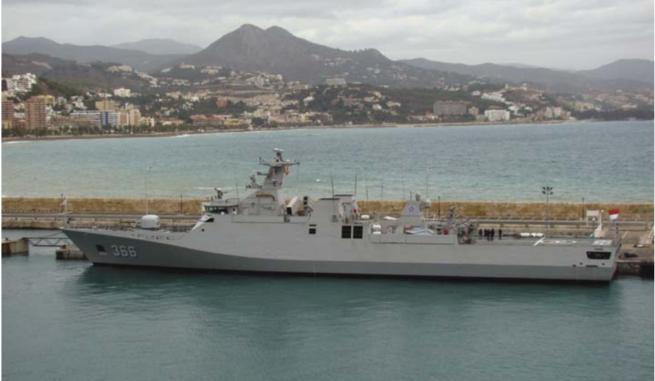
Fragata francesa clase Fremm . Marruecos cuenta con un barco de esta clase. (Foto: www.wikipedia.org ).