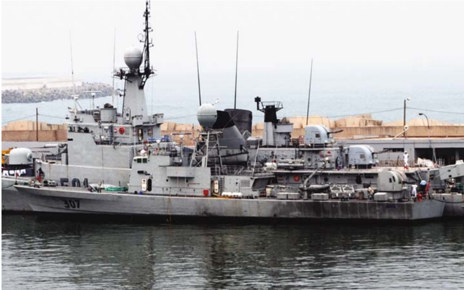
Patrullero marroquí Commandant Azouggarh de la clase Lazaga .

nació del impulso dado por el rey Mohamed V y del trabajo de organización del primer jefe, el vicealmirante Mohamed Trild. Su nacimiento se puede situar en el 1 de abril de 1960, con los cometidos de proteger los 3.952 km de costa y las 85.000 millas cuadradas de Zona Económica Exclusiva (ZEE), garantizar la seguridad del estrecho de Gibraltar y luchar contra el contrabando.