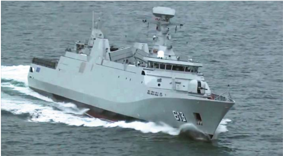
Fragata Tarik ben Ziyad (613) de la clase Sigma .

Las tres fragatas Sigma son de dos tamaños. La más grande, la Tarik ben Ziyad , fue la primera. Su entrega tuvo lugar el 10 de septiembre de 2011 y fue presentada el 23 de diciembre siguiente en Casablanca, en un acto que estuvo presidido por el rey Mohamed VI. Mide 105 m de eslora, 13 de manga, desplaza 2.400 t y puede embarcar un estado mayor. Las otras dos son: la Sultan Moulay Ismail , entregada el 10 de marzo de 2012, y la Allal ben Abdellah , el 12 de septiembre del mismo año. Ambas miden 98 m de eslora, 13 de manga y desplazan 2.075 toneladas. Su propulsión es diésel con dos motores SEMT Pielstick 20PA6B, dos ejes con hélices de paso variable, tienen una velocidad de crucero de 18 nudos, máxima de 28 nudos y su autonomía es de 4.000 millas. Arman misiles antiaéreos MICA, dos modernos lanzadores de misiles Exocet antibuque de la versión MM40, un montaje proel Oto Breda de 76/62 mm superrápidos (de 120 disparos por minuto), dos cañones de 20 mm, torpedos anti-submarinos A244 y otras piezas menores. Cuentan con cubierta de helicópteros y hangar para operar con helicópteros Panther . Tienen habitabilidad y espacio para alojar personal de fuerzas especiales con su impedimenta. Y