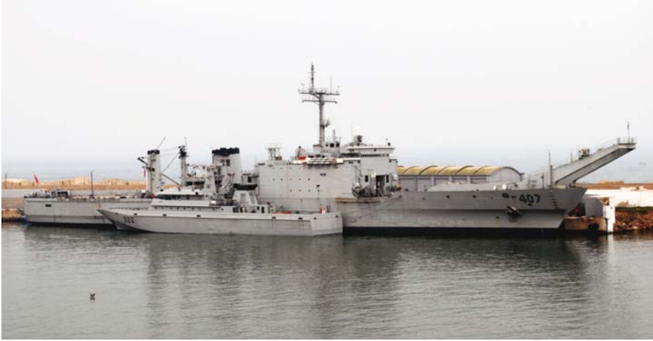
LST Sidi Mohammed ben Abdallah . (Foto: www.wikipedia.org ).

hoy parece ser una de sus prioridades, aun a sabiendas de que su obtención y manejo pueden ser procesos muy complejos, laboriosos y largos.