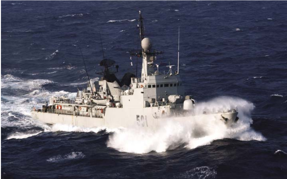
Corbeta Lieutenant Colonel Errahmani de la clase Descubierta . (Foto: www.wikipedia.org ).

Ha sido el buque insignia de la Marina Real marroquí durante más dos décadas y ha participado en muchos ejercicios nacionales y multinacionales, entre ellos, el MAJESTIC TAGLE del año 2004, encabezado por los Estados Unidos. En el mes de octubre de 2017 fue enviada a Navantia Cartagena para una profunda revisión.