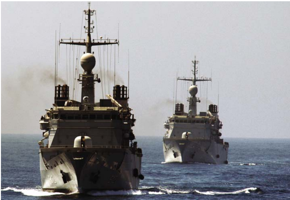
Fragatas Mohammed V y Hassan II de la clase Floreal . (Foto: www.wikipedia.org ).

Con cierta frecuencia participan en ejercicios con unidades de otras naciones y efectúan visitas a puertos extranjeros, como es el caso de la Hassan II , que del 20 al 23 de abril del presente año entró en Ferrol en compañía de la también marroquí Sultan Moulay Ismael de la clase Sigma . Ambas se encontraban efectuando un crucero de instrucción con 60 guardiamarinas de Marruecos y de otros países africanos e hicieron escala en el puerto gallego tras haber entrado en los de Ámsterdam y Saint-Nazaire.