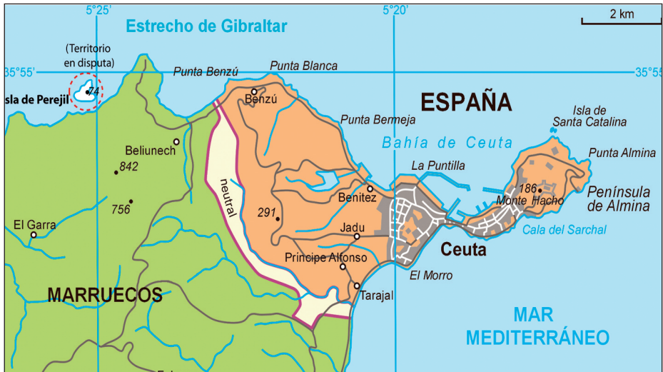
Figura 1. Mapa de la zona.

El 11 de julio de 2002 una docena de miembros de la Gendarmería Real de Marruecos desembarcó y colocó dos banderas en un pequeño islote de soberanía disputada. Llamado Perejil en España, Leila y Tura en Marruecos, se encuentra a escasa distancia de la costa marroquí y a 10 km de la ciudad de Ceuta en el estrecho de Gibraltar. Pocas horas después, miembros de la Guardia Civil española se acercaron a la zona y exigieron la retirada de los gendarmes, que habían instalado tiendas de campaña con la intención de permanecer