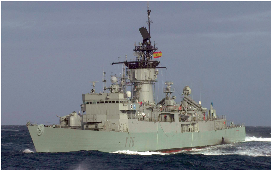
Fragata Extremadura . (Foto: www.flickr.com/photos/armadamde ).

Ese dique seco centenario vacío, rodeado de modernos jardines que se abren a la bahía junto al Museo, es un gran ejemplo de aquello en lo que nos hemos convertido y la mejor demostración de la necesidad de experiencias como las que P. Penagos nos propone en cada una de sus exposiciones: quizá enfrentarnos a la realidad más honrosa de nuestra propia historia, para poder creémosla, sea la única manera de dejar de escondernos en la ignorancia o de refugiarnos en el complejo para no tener que alzar la voz frente al olvido de quienes con su sacrificio hicieron de nuestro pueblo uno de los más marineros e insignes de la Historia.