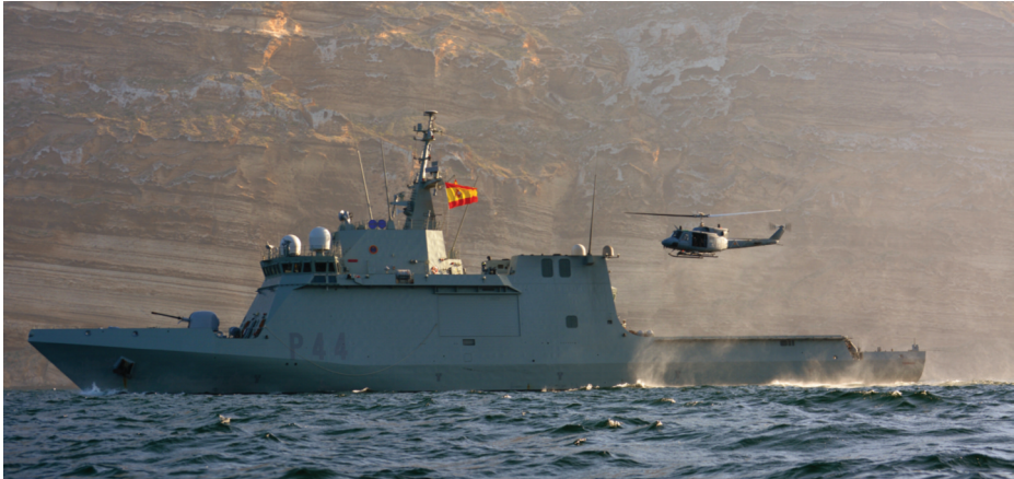
BAM Meteoro durante su despliegue en África.

La realidad es que el golfo de Guinea es una región de gran interés para España. De acuerdo con la Estrategia de Seguridad Nacional 2017 : «El golfo de Guinea es importante para la seguridad de España pues presenta amenazas que incluyen actos de robo a mano armada en la mar y piratería, pesca ilegal no declarada y no reglamentada y el tráfico ilícito de personas, sustancias estupefacientes y armas. Es además fuente de importantes recursos energéticos para España y objeto de inversión en infraestructuras e intereses agrícolas, industriales y pesqueros» (7).