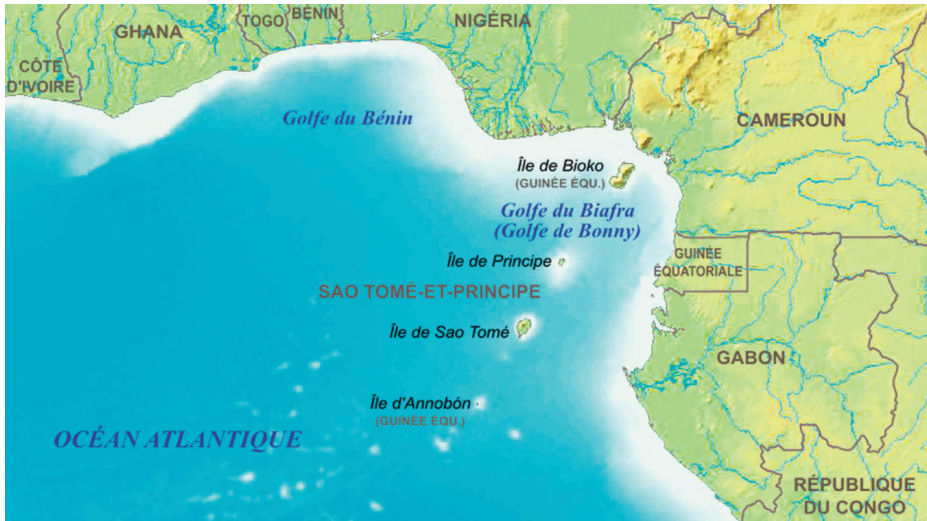
Golfo de Guinea (Fuente: www.wikipedia.org ).

Para España, Senegal es de una importancia vital. La inversión puesta en marcha en Senegal y Mauritania, tanto económica como de medios y efectivos para luchar contra la inmigración ilegal en origen ha resultado un éxito tal que ha sido tomada como referente en la UE. España mantiene en este país de manera permanente un destacamento de la Guardia Civil, con dos patrulleras, a las que de manera periódica se unen un buque oceánico y un avión del tipo CN-235. Además, el destacamento de la Guardia Civil se encarga de labores de instrucción y enseñanza a los gendarmes senegaleses. Lo mismo ocurre en Mauritania.