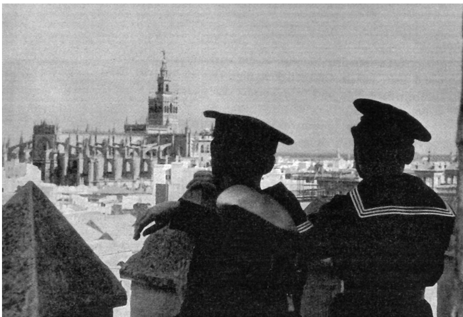
Flechas Navales observando la Giralda. (Fuente: Junges Spanien, p. 84).

No nos vamos a detener en profundidad sobre sus usos a lo largo de la historia y su vinculación con la Armada, perfectamente detallada por uno de sus comandantes-conservadores en esta misma REVISTA GENERAL DE MARINA (4), pero sí queremos hacer hincapié en el interés de la Marina por preservar su utilidad, destacando cuatro hitos claves: la instalación de la Capitanía del Puerto entre los años 1822 y 1823; la declaración de monumento a enajenar en 1869, a finales del llamado Sexenio Revolucionario, etapa que en Sevilla se caracterizó por el derribo de sus puertas y murallas, momento en que la Comandancia de Marina inicia las gestiones para mantener su uso, siendo autorizado su usufructo el 7 de enero de 1870 por el regente del reino (5). Ya en el