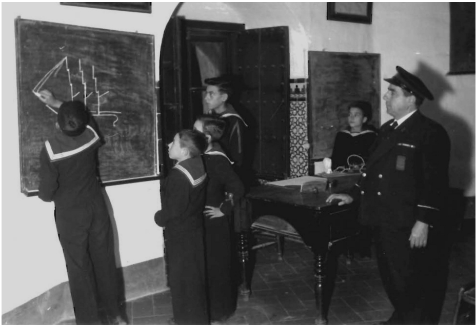
Clases en la E. F. N. Torre del Oro.

Sin embargo, pese a este doble ofrecimiento, en diciembre de 1939, durante la inauguración del nuevo curso, el director García de la Vega anuncia a los alumnos: «Hoy tendréis estas clases. Dentro de unos meses dispondréis de un barco» (29), por lo que podemos deducir que ambas donaciones no llegaron a materializarse. No obstante, esto no fue obstáculo para que los flechas más