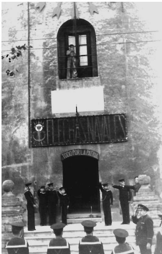
Arriado de bandera en la E. F. N. Torre del Oro.

La acuciante necesidad de especialistas y clases que tenía la Marina nacional, tras la desafección hacia sus mandos naturales de gran parte de la marinería y clases de la Escuadra, y los tremendos sucesos ocurridos en las