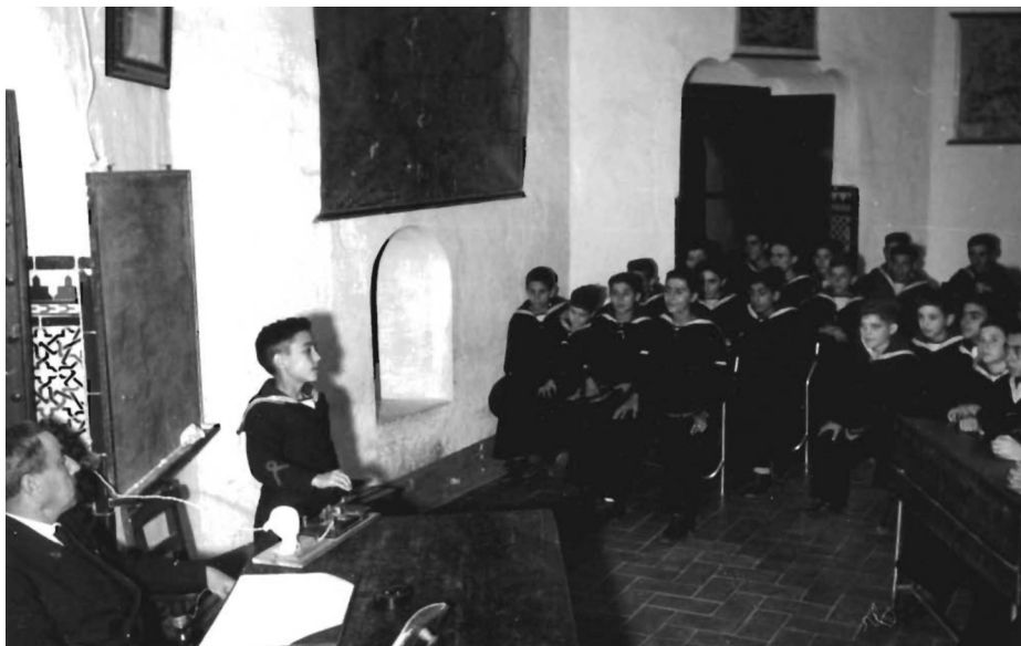
Clases en la E. F. N. Torre del Oro.