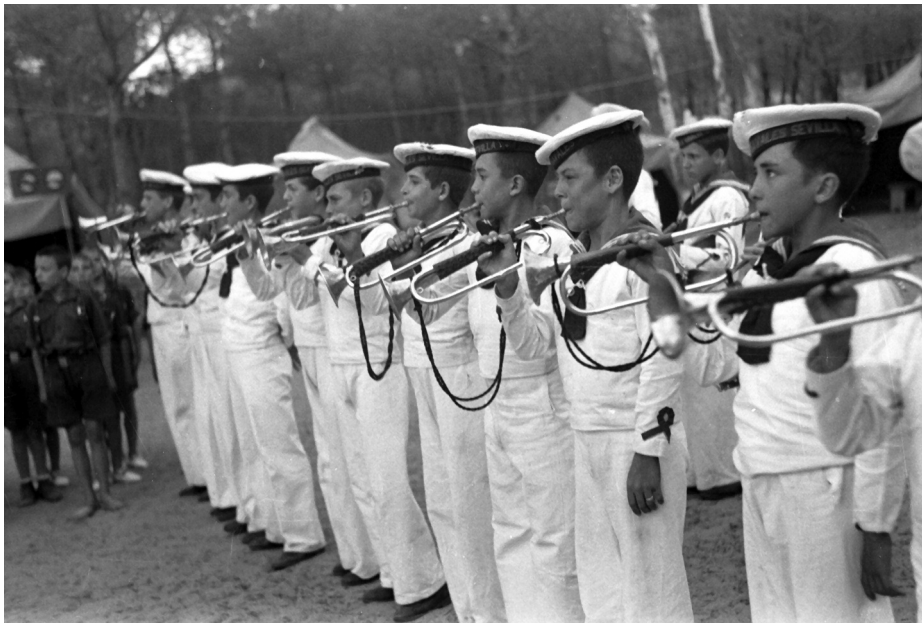
Banda de los flechas navales. (Fototeca Municipal de Sevilla. Archivo Gelán).

1929 (36), y teniendo en cuenta que el nuevo Museo, inaugurado en junio de 1944, requeriría de un tiempo para reformar y adaptar el interior de la Torre del Oro a su nueva funcionalidad, sería interesante preguntarse cuáles pudieron ser sus causas: ¿la ausencia de un barco para las prácticas?, ¿la intención del Ayuntamiento y/o la Armada de recuperar el proyecto de Museo Marítimo?, ¿la existencia de la Escuela Náutica de San Telmo?, ¿la pérdida del interés de la sociedad sevillana hacia su río? Son muchas las cuestiones que podríamos plantearnos al respecto.