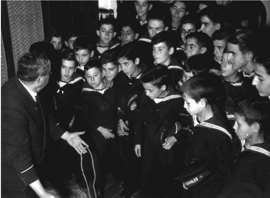
Clase de nudos. E. F. N. Torre del Oro.

avanzados sirviesen en unidades de la Armada, siendo designados para su embarque tres alumnos mayores de 17 años de la especialidad de Radiotelegrafía (30).