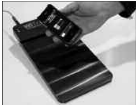
Sistema mundial de carga inalámbrica para dispositivos de consumo.