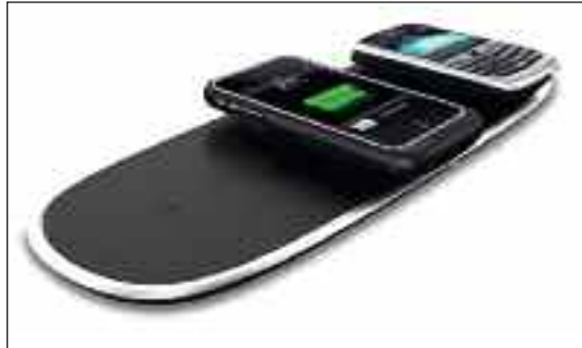
Tapete de recarga inalámbrico.

Estos sencillos pasos están definidos para un único dispositivo, pero los avances técnicos permiten que se pueda utilizar este mismo principio para cargar varios dispositivos al mismo tiempo. Así, existen tapetes patentados (2) que utilizan bobinas para crear un campo magnético y enlazan con dispositivos electrónicos que utilizan receptores con bobinas compatibles (incorporados o plug-in ) para recargar sus baterías mientras descansan en estos «tapetes de recarga».