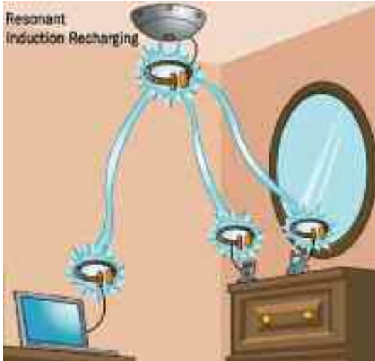
Transferencia de energía resonante inalámbrica.

Así, el trabajo preliminar del equipo MIT sugiere que este tipo de configuración podría recargar no solo dispositivos relativamente cercanos (en una habitación o varias habitaciones de una vivienda,