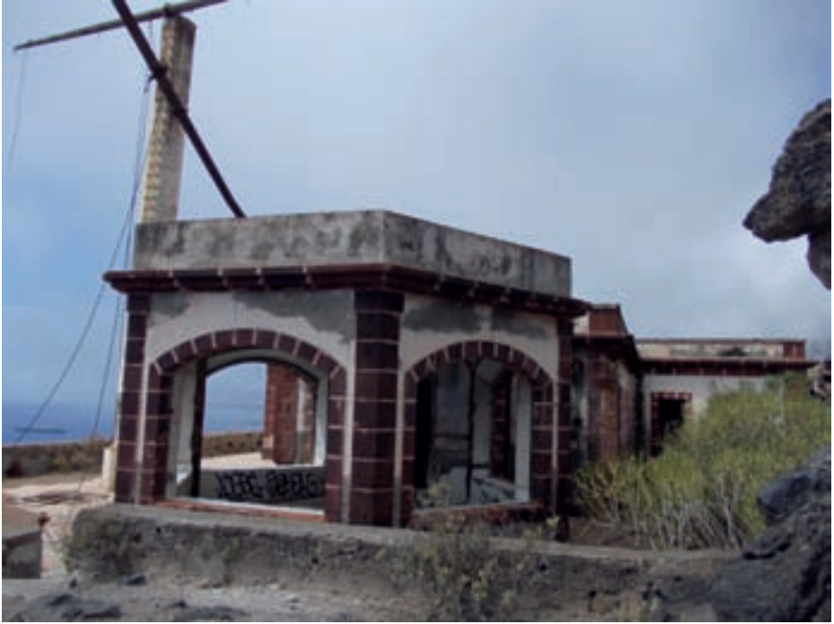
Observatorio de planta hexagonal del semáforo.

me de la comisión mixta, se construirá el semáforo de La Atalaya de Anaga, algo más al norte de la playa de La Jurada y del entronque del cable submarino que ya une Canarias con el resto del mundo. Según el modelo calificado como núm. 2 de 31 de mayo de 1884, publicado en la Revista de Obras Públicas (8), consta de un cuerpo rectangular con dos viviendas para los vigías, con varias habitaciones, cocina y retrete; otro cuerpo rectangular adosado al anterior, que sirve de vivienda al ordenanza y otras dependencias, y un tercer cuerpo hexagonal, separado de los anteriores por un pequeño vestíbulo, destinado a observatorio. Cuenta además con dos aljibes que se alimentan del agua de lluvia recogida en la azotea, y un horno de pan exterior.