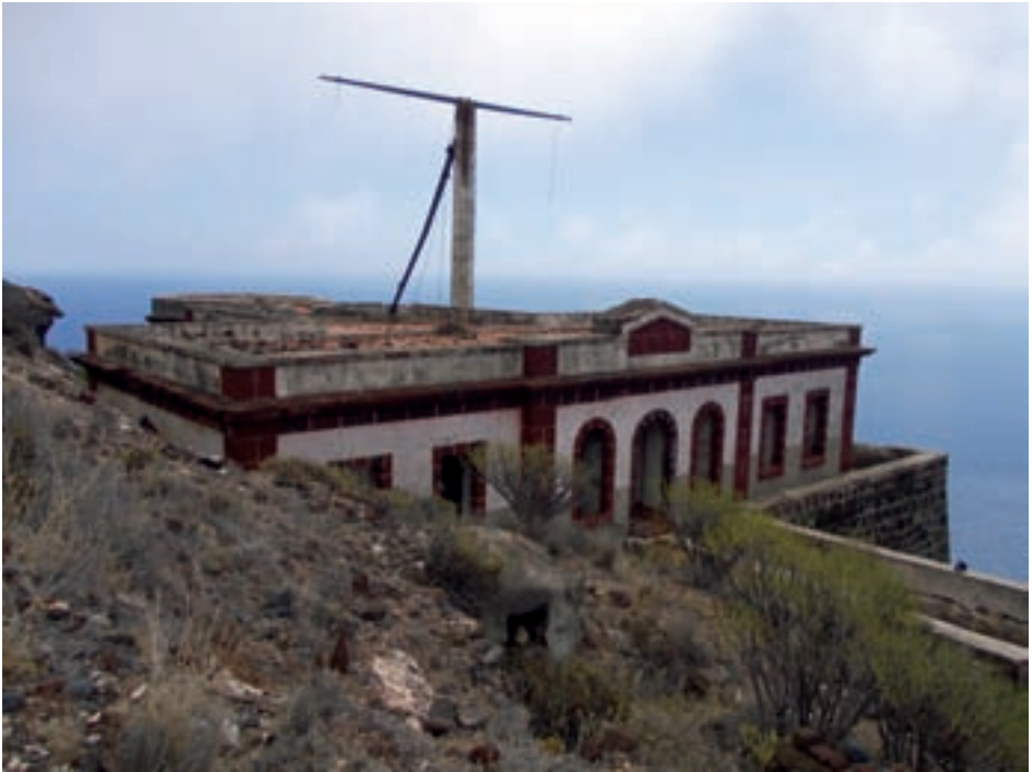
Fachada principal del semáforo de La Atalaya en Tenerife.

Como consecuencia del desplome de nuestro imperio marítimo, la Armada se retira del control de los grandes espacios marítimos hacia la costa. Así se crean las comandancias de Marina en 1803 (2). Y los atalayeros, que antes dependían de los gobernadores militares, pasan a vincularse a las nuevas comandancias, que van centralizando las funciones del control del tráfico marítimo que realizaban los juzgados de Indias y los consulados del mar.