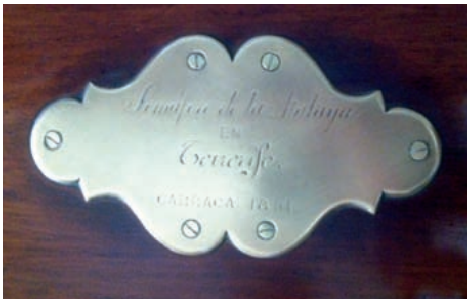
Placa sobre los baúles fechada en 1891.

dominantes hacían de estas cumbres un magnífico observatorio desde donde alertar sobre la llegada de buques amigos, prevenir a la población ante un ataque inminente o informar del estado de la mar en las aguas libres del norte. Sin embargo, la primera razón de peso para el establecimiento de atalayas de observación fue la de prevenir la llegada de brotes epidémicos a la isla a bordo de buques infectados. Así que, el 18 de abril de 1506, el Cabildo de Tenerife acuerda el nombramiento de los primeros atalayeros.