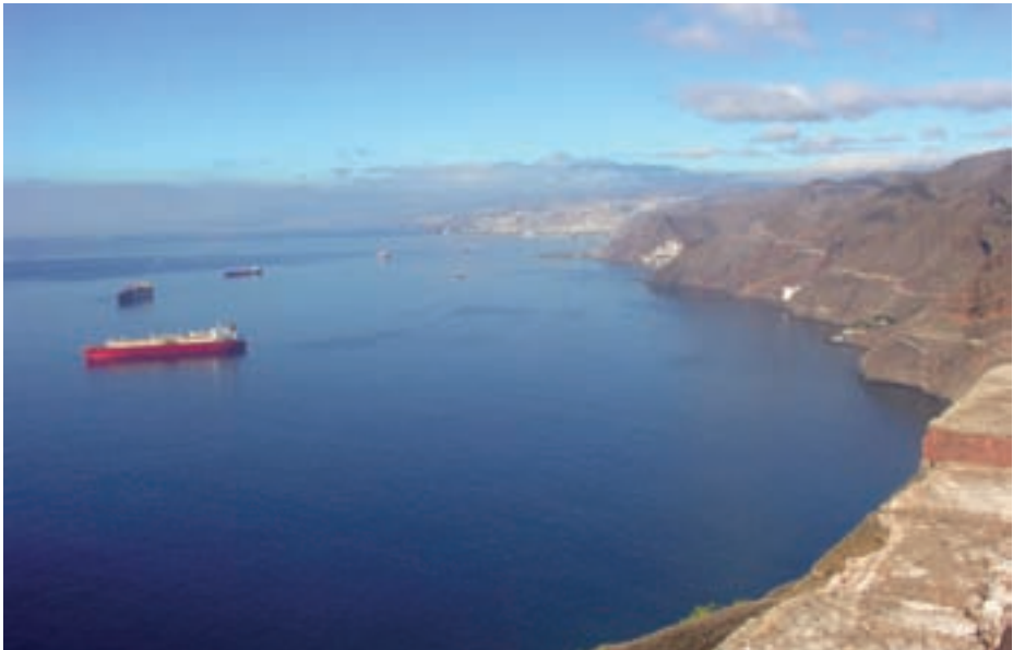
Vista del puerto de Santa Cruz de Tenerife desde el semáforo.

Pero aquella madrugada, no se sabe por qué, los atalayeros no encendieron sus hogueras. La sorpresa impidió maniobrar a los barcos españoles, que fueron incendiados y destruidos por Blake, incluidos los dos galeones, aunque no se llevaron el tesoro ni se atrevieron a poner un pie en tierra. El año siguiente Diego de Egüés consiguió desembarcar la plata en El Puerto de