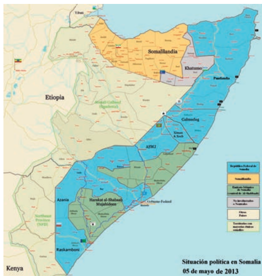
Situación política de Somalia a fecha 5 de mayo de 2013.

siones, aplicación extrema de la sharia , asesinatos indiscriminados, prohibición de reparto de la ayuda humanitaria, etcétera.