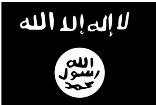
Bandera de Al Shabab.

una alternativa efectiva frente al desgobierno y la falta de legislación del país.