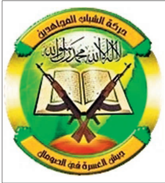
Escudo de Al Shabab.

La campaña de comunicación orquestada por Al Shabab, a través de Internet (8), de los medios de comunicación locales —emisoras de radio, con propaganda y canciones yihadistas, e incluso en un canal de televisión, Al