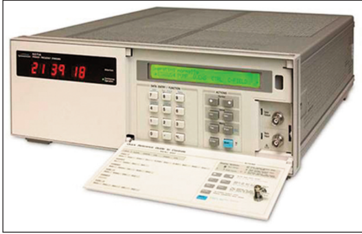
Patrón atómico de haz de cesio. El ROA cuenta en la actualidad con cinco de estos patrones y un máser de hidrógeno activo.

UT en más de 0,9 segundos de la forma que se describe más adelante. La escala UTC tiene la misma unidad que el TAI (el segundo del SI), por lo que un reloj de UTC ni atrasa ni adelanta con respecto a uno de TAI.