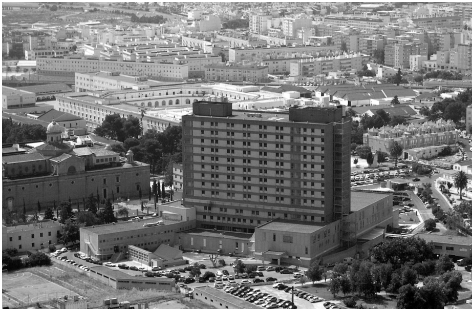
Vista aérea del Hospital de San Carlos.

el cual quedó bajo la jurisdicción de la Armada hasta el año 2002, en que se integró en la Red Sanitaria Militar de la Subsecretaría de Defensa.