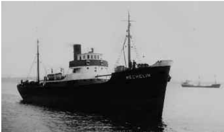
Imagen del Mechelín en Santander. (Foto: Blánquez).

primeros del año 1961 no se resolvió el expediente de remolque número 382-56 con las indemnizaciones y el precio a recibir por el armador y la tripulación del Bahía de Cádiz por la asistencia prestada al Mechelín .