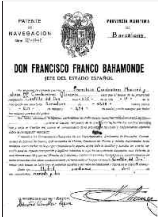
Patente de Navegación del Castilla del Oro . (Dirección General de la Marina Mercante).

esa misma fecha, sus propietarios solicitaron a la Subsecretaría de la Marina Mercante el cambio de la Lista 1. a por la 2. a , además de su autorización para practicar navegación de cabotaje, de acuerdo con el Decreto de 26 de mayo de 1943, que aprobaba el texto refundido de las Leyes de Protección a la Construcción Naval. La justificación se encontraba en su artículo 5: «Podrán excusarse... las obligaciones que imponen los tres artículos precedentes... en cualquiera de los casos siguientes: d) Cuando en el buque adquirido del extranjero, teniendo menos de diez años de vida, se efectúen en España obras de reconstrucción o modificación que no puedan ser consideradas como entretenimiento normal y cuyo importe no ha de ser inferior a las dos terceras partes del valor del buque una vez reconstruido o modificado». Al terminar el año 1943, el Castilla del Oro , de 521 TRB, compartía naviera con otro costero de 567 TRB llamado La Guardia .