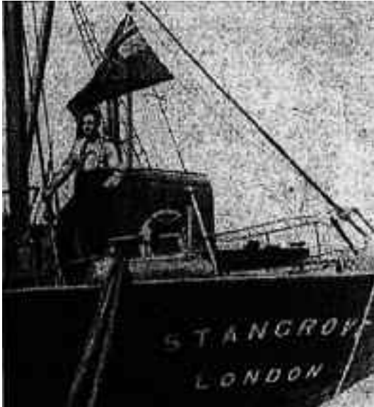
Detalle de la popa del Stangrove en plena Guerra Civil.