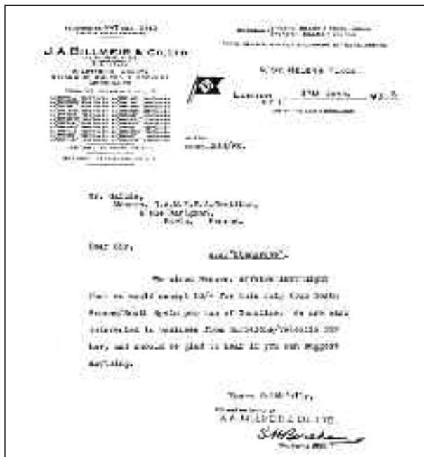
Comunicación de los propietarios del Stangrove acerca de su fletamento por CAMPSA-Gentibus. (Archivo del Ministerio de Asuntos Exteriores).

la cuestión. Esa mañana la niebla era muy intensa por toda la zona. Sin embargo, en un mensaje de radio el Alcázar de Toledo comunicaba haber apresado al vapor a 2,5 millas al norte de punta Coin. A la llegada del Almirante Cervera ambos estaban parados a unas dos millas escasas de la costa. Poco después hacía acto de presencia el crucero británico. El Stangrove tenía izadas las señales del código internacional «Deseo hablar con usted», solicitando el comandante del Southampton permiso para acercarse al vapor. Tras la conversación mantenida por los británicos, en el Almirante Cervera se recibía el siguiente mensaje: «Capitán insiste en que su situación era 12 millas ENE de cabo Torres en el momento de su captura, habiendo dejado el puerto de Gijón a las 4h. 45m. Observador n.º 134 confirma eso. Esta situación le colocaría alrededor de 5 millas fuera de las aguas territoriales». A partir de ese momento empezó un intenso intercambio de mensajes entre los comandantes de ambos cruceros. Al final, el contralmirante Calvert, a bordo del HMS Southampton , se terminó saliendo con la suya, y el Stangrove pudo continuar viaje al país vecino, con la tranquilidad para sus ocupantes y las protestas del capitán de navío Moreu, comandante del crucero nacional.