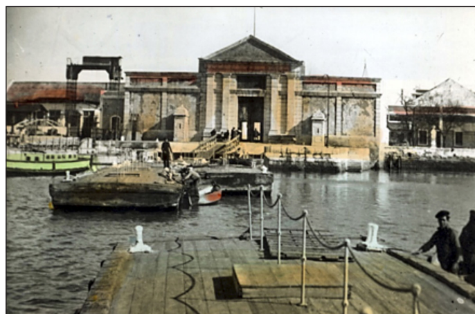
Figura 1. Antigua Puerta de Tierra del arsenal de La Carraca. Tomado de: https://www.google.es/search?q=Puerta+de+Tierra+del+arsenal+de+la+carraca&biw=1024&bih=744&tbm=isch&to=u&source=univ&sa=X&ei=J0eaVe6wGcHeUoeNpxA&ved=0CCAQsAQ Acceso: 2015-07-06.

En el primer proyecto general conocido del arsenal, figuraba la edificación de un hospital y una botica en la franja norte (8) .