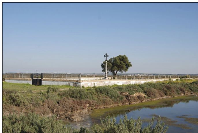
Figura 3. Cementerio del arsenal de la Carraca (autor).

Dentro de los profesionales quirúrgicos de los hospitales se encontraban el cirujano mayor y los practicantes de cirugía. El cirujano mayor era nombrado por el Rey, estando encargado de la selección del personal a sus órdenes, del instrumental y de las intervenciones de su disciplina: «fracturas simples o complicadas, amputaciones y mutilaciones de todas clases, y otras operaciones que se ofrezcan, sin permitir que ningún Ayudante de Cirujano, o Segundo Ayudante las practique, sino en caso de haberles primero dado parte, y comunicado la