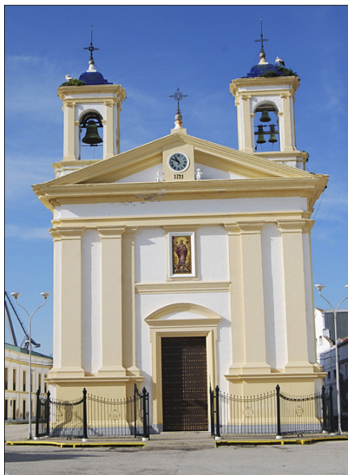
Figura 4. Iglesia del arsenal de la Carraca (autor).

La epidemia afectó de lleno a toda la población residente en el arsenal y en especial al regimiento de infantería ligera Valenney número 36 (tambores, soldados, granaderos, cazadores y suboficiales) (64) que contabilizó 101 fallecidos, seguidos de 86 marineros, 38 grumetes, 22 rondines, 10 artilleros de mar, 8 presidiarios, 8 aserradores, 7 peones, 4 carpinteros de ribera, 3 veleros, 3 soldados el regimiento de Marina, 2 buzos de «baxeles», capataces, armeros, escribientes, maestros sanadores, enfermeros, presbíteros, obradores, inválidos, particulares, contra maestros, etc., sin que hubiese ninguna clase