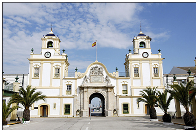
Figura 5. Puerta de Mar del arsenal de la Carraca.

La llegada de nuevos prisioneros a la bahía de Cádiz continuó durante el año 1809 siendo utilizados por las autoridades