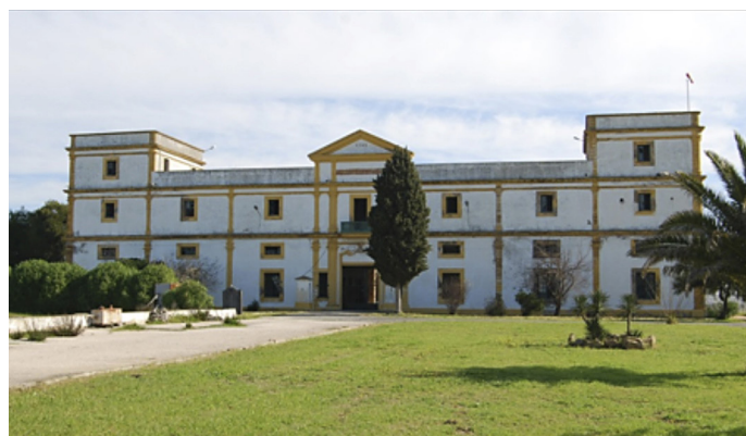
Figura 2. Penal-presidio de Cuatro Torres del arsenal de la Carraca.