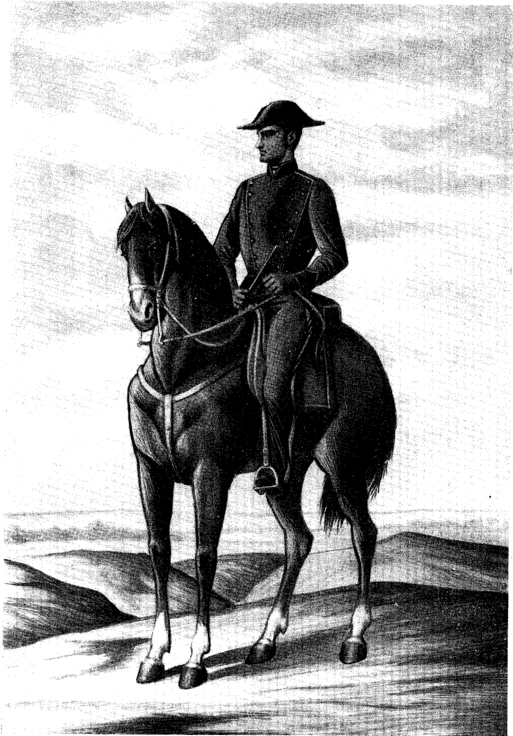
Capellán en uniforme de 1886. Dibujo de la colección de láminas de Gimenez: Litografía de Zarza (Servicio Histórico Militar).