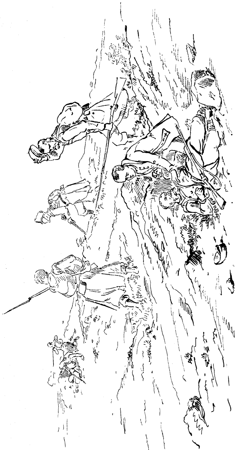
Capellán Castrense. De la Colección de Dibujos a la Pluma por el alférez alumno de la Academia de Ingenieros del Ejército, don Nemesio Lagarde. Guadalupe, Litografía de la Academia, 1878.