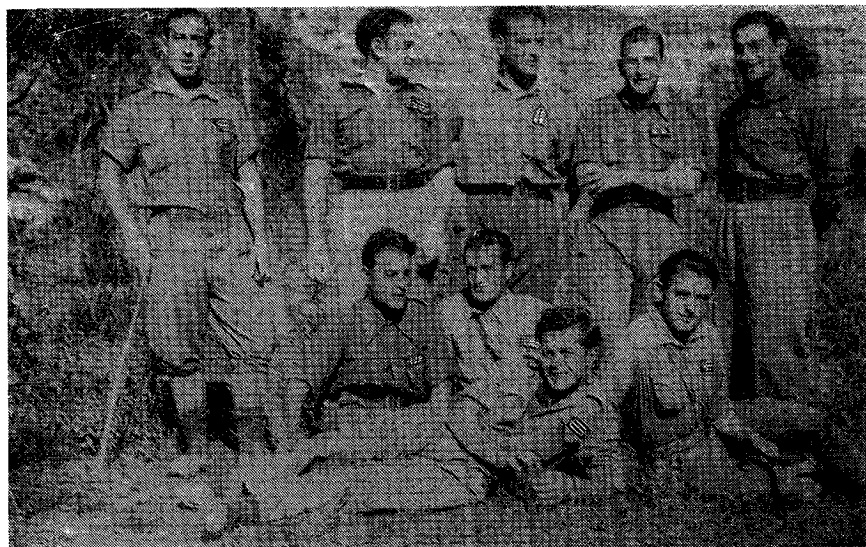
Los sargentos provisionales de la 66 Compañía de San Marcial en el frente de Tremp (Lérida).