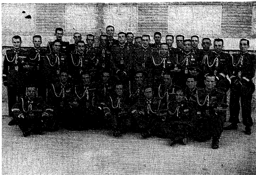
Una Sección de Clase del primer curso de la Academia de Transformación de sargentos provisionales. Enero-mayo de 1943.