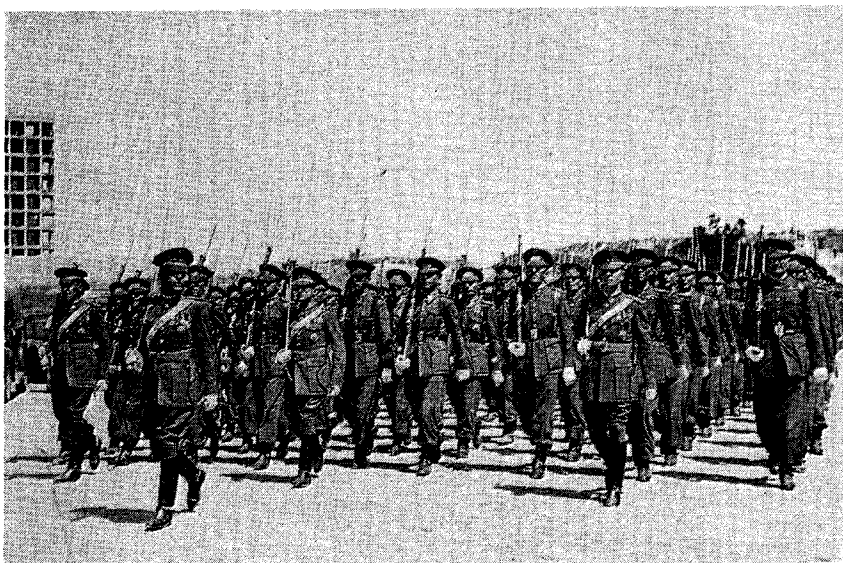
La primera promoción de la Academia de Transformación de Sargentos Provisionales desfila ante las ruinas de la Ciudad Universitaria en mayo de 1943.