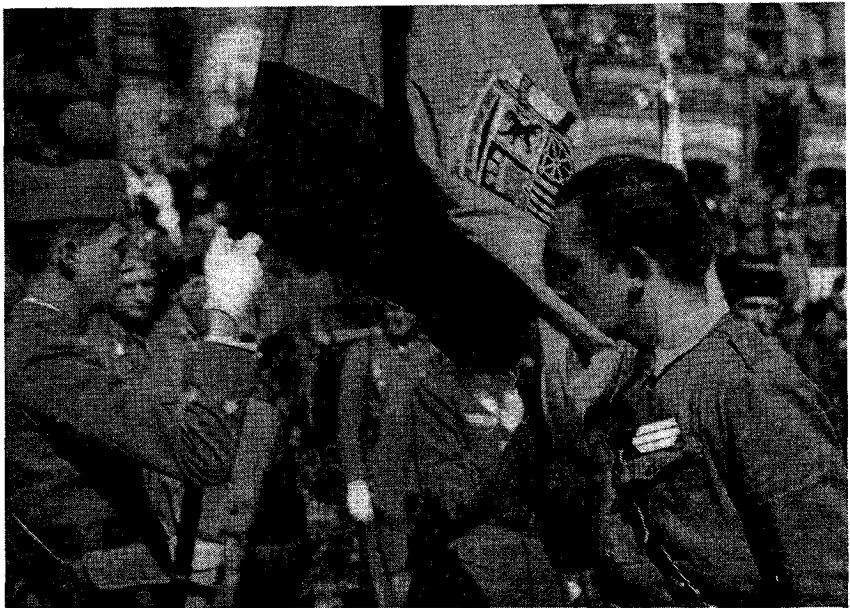
Jura de bandera de una promoción de sargentos provisionales, celebrada solemnemente en San Sebastián, con expectación popular, el 20 de marzo de 1938.