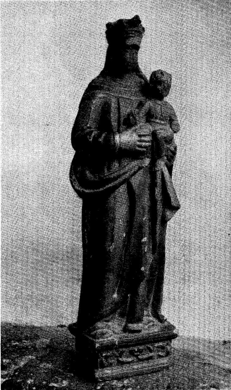
Imagen de Nuestra Señora de la Gracia, de la Iglesia Parroquial de El Bruch, mutilada por los franceses a su paso por esa localidad, el 14 de junio de 1808. Figuró en la Exposición Histórica de la Guerra de la Independencia. Igualada, 1908.