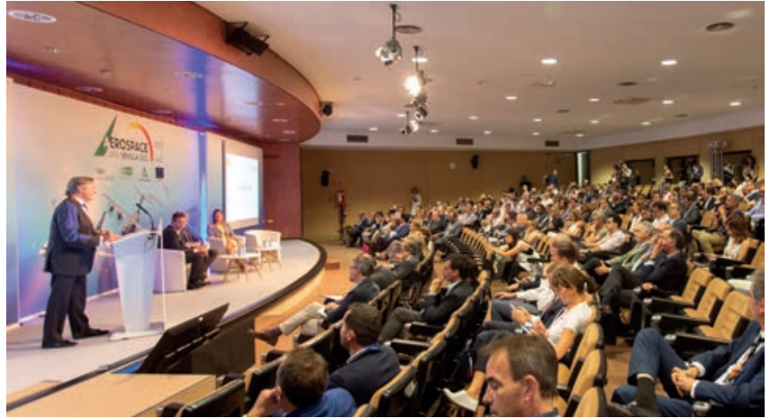
Panel de discusión sobre inteligencia artificial y la digitalización del mantenimiento

Otro panel de discusión llevó por título «¿Cómo de cerca estamos de descarbonizar el sector de la aviación?», en el que intervendrá la asociación Ellas vuelan alto, asociación cuyo objetivo principal es el de visibilizar el talento femenino del sector aeroespacial, y que estuvo moderada por la responsable para la adquisición de piezas detalladas de material compuesto de Airbus Defence and Space. La compañía tiene el propósito de ser pionero del sector aeroespacial sostenible, que será