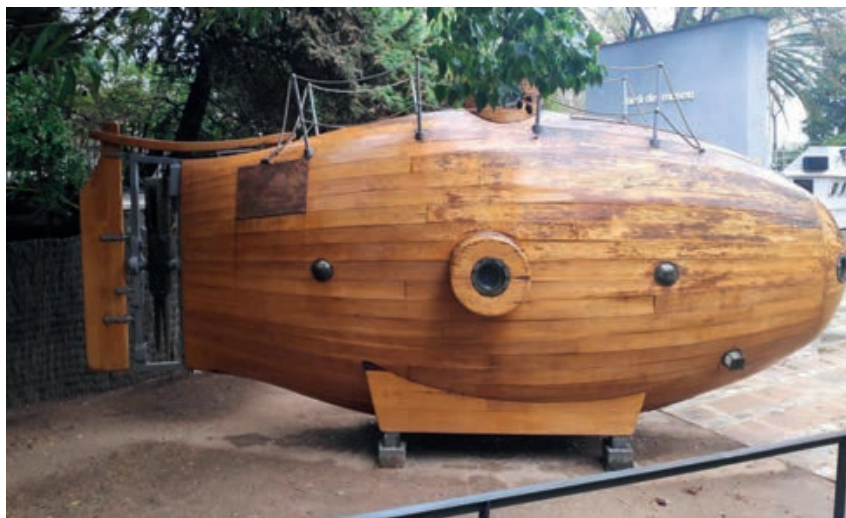
N. Monturiol, pionero de la navegación submarina con el Ictineo

Otros muchos personajes del malogrado siglo XIX español podrían figurar con letras de molde dentro del grupo de grandes científicos. Dejando a muchos de ellos en el tintero,