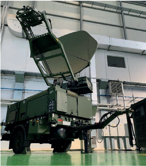
MGGS: MGCC, Ku SATCOM

básica MDU de un único MGEC se le pueden añadir otros elementos MGEC, o incluso interconectar esta con otra entidad PED desplegable, incrementando así el número de analistas y observadores.