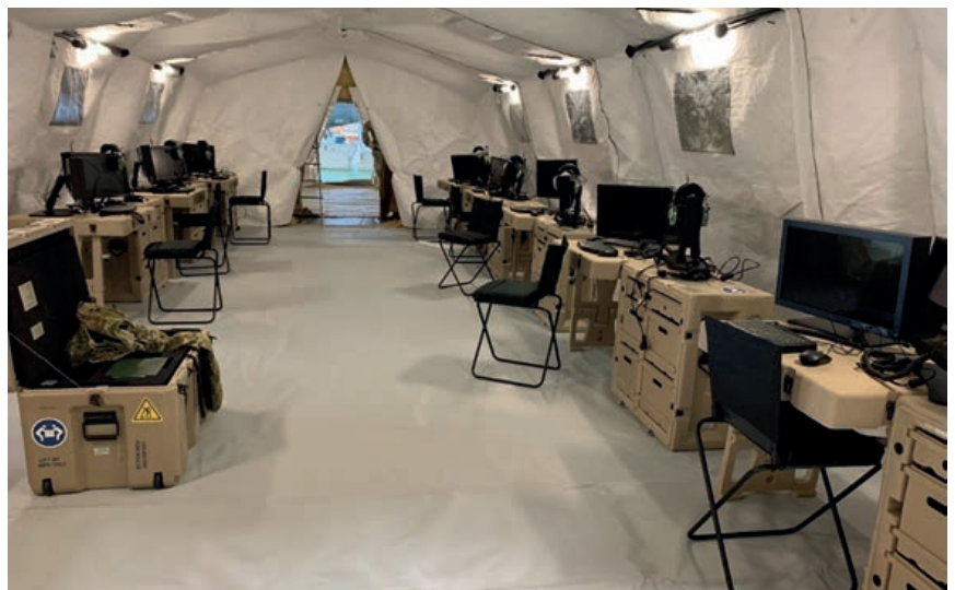
TGGS: sala PED

Su Sala PED consta de ocho estaciones operacionales de trabajo (OWS) similares a las de las instalaciones fijas del MOSC y del PED Centre; sus diversos modos de trabajo y programas disponibles van en función de cada posición: