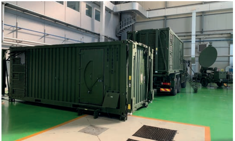
MGGS: MGEC o componentes de producción, explotación y diseminación en despliegue

Puede posicionarse en zona de operaciones tanto por medios marítimos, aéreos (C-130 o de mayor capacidad) o terrestres (sobre camiones tácticos, que son de dotación de la unidad). Una vez en destino, su asentamiento, despliegue, conectividad y declaración de capacidad operacional plena (FOC) en un área de operaciones no debe exceder de ocho horas, de acuerdo con los requisitos técnicos.