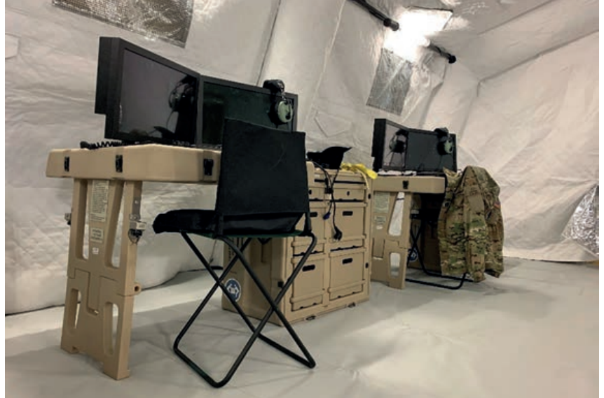
TGGS: OWS configurables con roles INTELSUP, SVC/O, IA

Con una plantilla de doce personas, la DB la conforman: