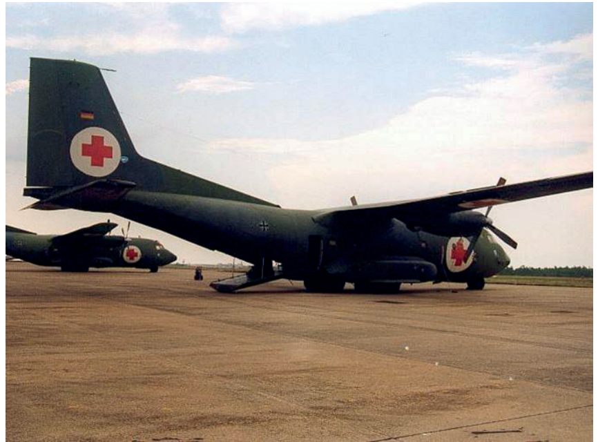
C-160 preparado para realizar una aeroevacuación médica

más cantidad de carga o pasaje. Pese a que actualmente se observa un bajo índice de operatividad media diaria, con solo un tercio de la flota, el A400M ha supuesto un gran avance a