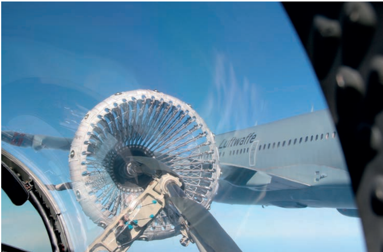
A310 realizando repostaje en vuelo bajo control del EATC

Dado el amplio abanico de misiones, de tipos de aeronaves y de nacionalidades, la panoplia de problemas que pueden aparecer es prácticamente indefinible. Si bien es verdad que hay algunos más recurrentes, como pueden ser la falta de autorizaciones diplomáticas para iniciar el vuelo, problemas técnicos en la aeronave, mala