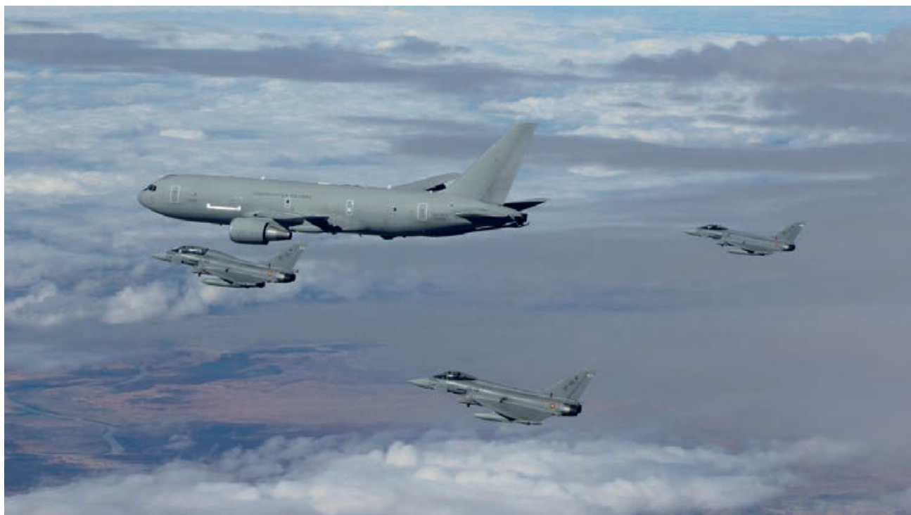
Agrupación aérea expedicionaria Red Flag 2016. El KC767 italiano fue taskeado por el EATC