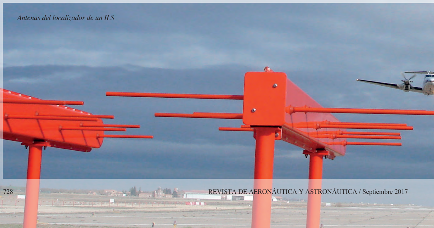
Antenas del localizador de un ILS

La herramienta que se utiliza para desarrollar la actividad nombrada, consta de una aeronave, una consola a bordo de ella e integrada con los parámetros de vuelo y personal, muy experto, con formación específica para desarrollar la inspección. Las técnicas de vuelo y posicionamiento de la aeronave para obtener el grado de bondad de los componentes del SNA ha evolucionado desde el seguimiento