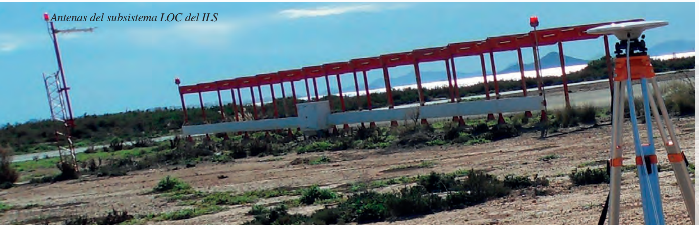
Antenas del subsistema LOC del ILS

–Inspección en vuelo (flight inspection): acción llevada a cabo por la Administración del Estado, que se efectúa para el conocimiento del servicio proporcionado por un sistema, subsistema o equipo del SNA y de sus maniobras publicadas, realizada con la participación de una aeronave y su tripulación, especialmente preparadas y autorizadas, con o sin personal en