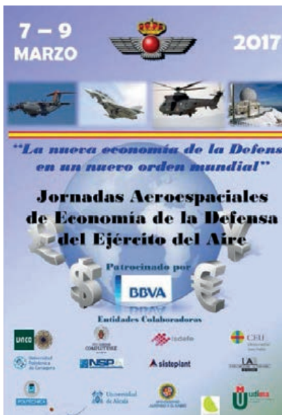
Cartel de las jornadas.

Tres décadas después, de nuevo a iniciativa del jefe de Estado Mayor del Ejército del Aire, el general del aire Francisco Javier García Arnaiz, con un formato diferente, pero posiblemente con una intencionalidad muy próxima a la de su predecesor en el cargo, ha sido planteado un evento orientado a revisar y complementar los conceptos tradicionales de la Economía de la Defensa, para actualizarlos al entorno actual y real de la seguridad y defensa global, evaluando el escenario previsible que pueda plantear la economía española en los próximos años, el de nuestra industria aeroespacial de defensa y su competitividad, los riesgos y amenazas globales previsibles, los nuevos modelos de adquisiciones y herramientas de gestión como la cooperación público-privada, la inteligencia estratégica económica y el impacto que en los años venideros pueda plantear el proceso conocido como de transformación digital para dicha industria y el propio Ejército del Aire, así como el importante papel que desempeñarán las nuevas estrategias de comunicación para el fomento de la cultura de Defensa.