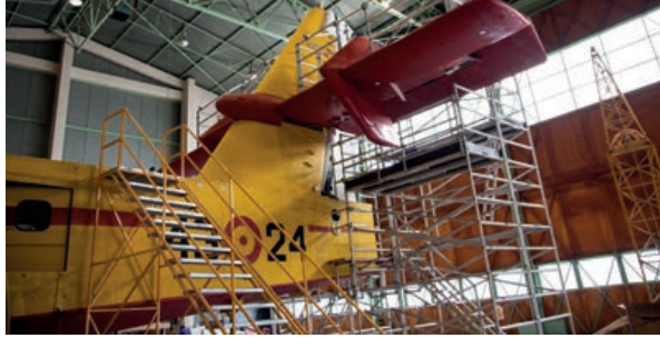
Mantenimiento aéreo de un avión UD-13 Canadair CL-215 en la Maestranza Aérea de Albacete.

a la economía de la seguridad y defensa, y a la gestión y transferencia tecnológica, dio a conocer su investigación sobre determinantes estratégicos en el modelo de modernización de las Fuerzas Armadas y de los sistemas de defensa, así como de los procesos de cooperación con organizaciones externas, RSC y comunicación estratégica en la gestión del conocimiento. Finalmente, en la presentación de sus conclusiones, trajo a colación varios ejemplos de empresas de la industria aeroespacial que responden al planteamiento doctrinal formulado.