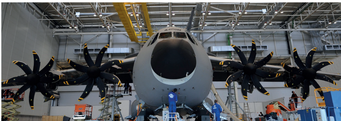
Ensamblaje del A400M en las instalaciones de San Pablo de Airbus en Sevilla.