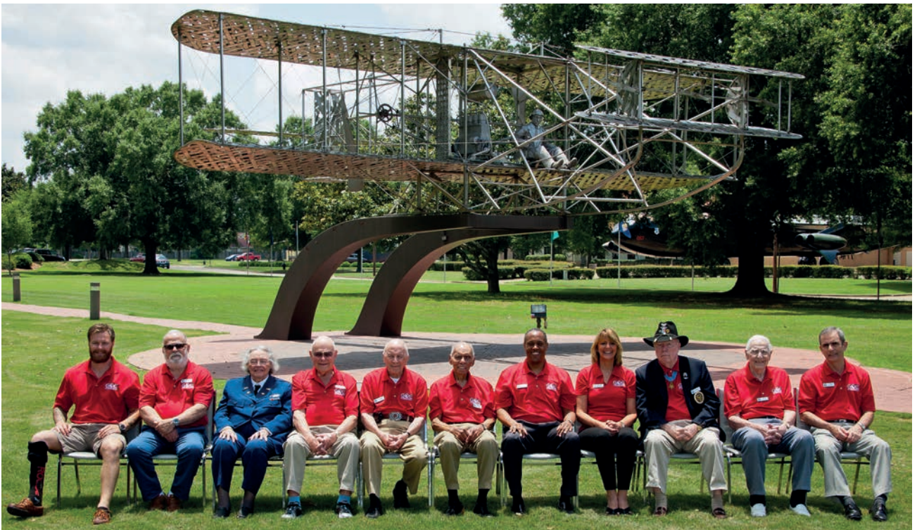
Grupo de "Eagles" del año 2015.

La celebración de eventos de este tipo tiene una gran importancia para motivar a las actuales generaciones, para que puedan disfrutar y aprender al mismo tiempo de las vivencias tan características de estas personas, que han realizado una gran labor en beneficio de la sociedad a lo largo de sus