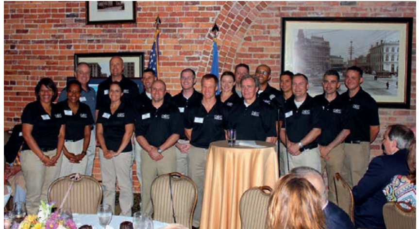
General Wells junto a los alumnos organizadores del Programa GOE 2015.

Una vez que los Jefes han elegido a los 15 miembros del equipo, éstos