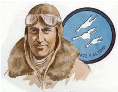
Retrato del aviador español José Larios (GOE 1984).

A partir de esa fecha, el Programa se viene celebrando anualmente con la participación de personajes ilustres, tanto norteamericanos como internacionales. Cabe destacar que hasta la fecha, el único “Eagle” español ha sido José Larios, que participó en el año 1984. Este destacado aviador de la Guerra Civil española combatió en el bando nacional pilotando un Fiat CR 32 bajo el mando del capitán Joaquín García-Morato, consiguió 6 derribos acreditados y otros 5 probables. En su libro “Combate sobre España: “Memorias de un piloto de caza”, se describen las batallas aéreas más representativas de la Guerra Civil española.