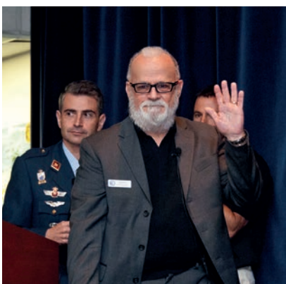
Momentos antes de la tan "esperada" entrevista.

carreras profesionales. Cada una de las historias personales de este grupo de "Eagles", debe de servir de inspiración para un nutrido conjunto de oficiales que tendrán en el futuro la responsabilidad de guiar al resto en la difícil tarea de consolidar el equilibrio y la paz a nivel mundial. Es muy importante destacar, y saber reconocer el gran valor demostrado por tantos "Eagles", tanto personajes célebres como no tan conocidos popularmente, cuyos sacrificios personales a lo largo de la historia han contribuido para asentar el estado de bienestar del cual todos nos podemos beneficiar en la actualidad.