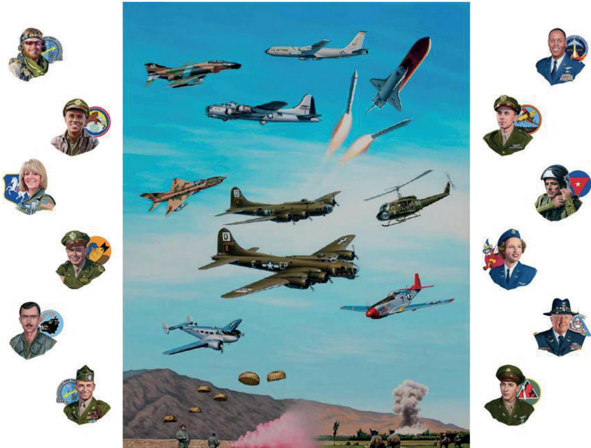
Litografía del 2015 con todos los “Eagles”.