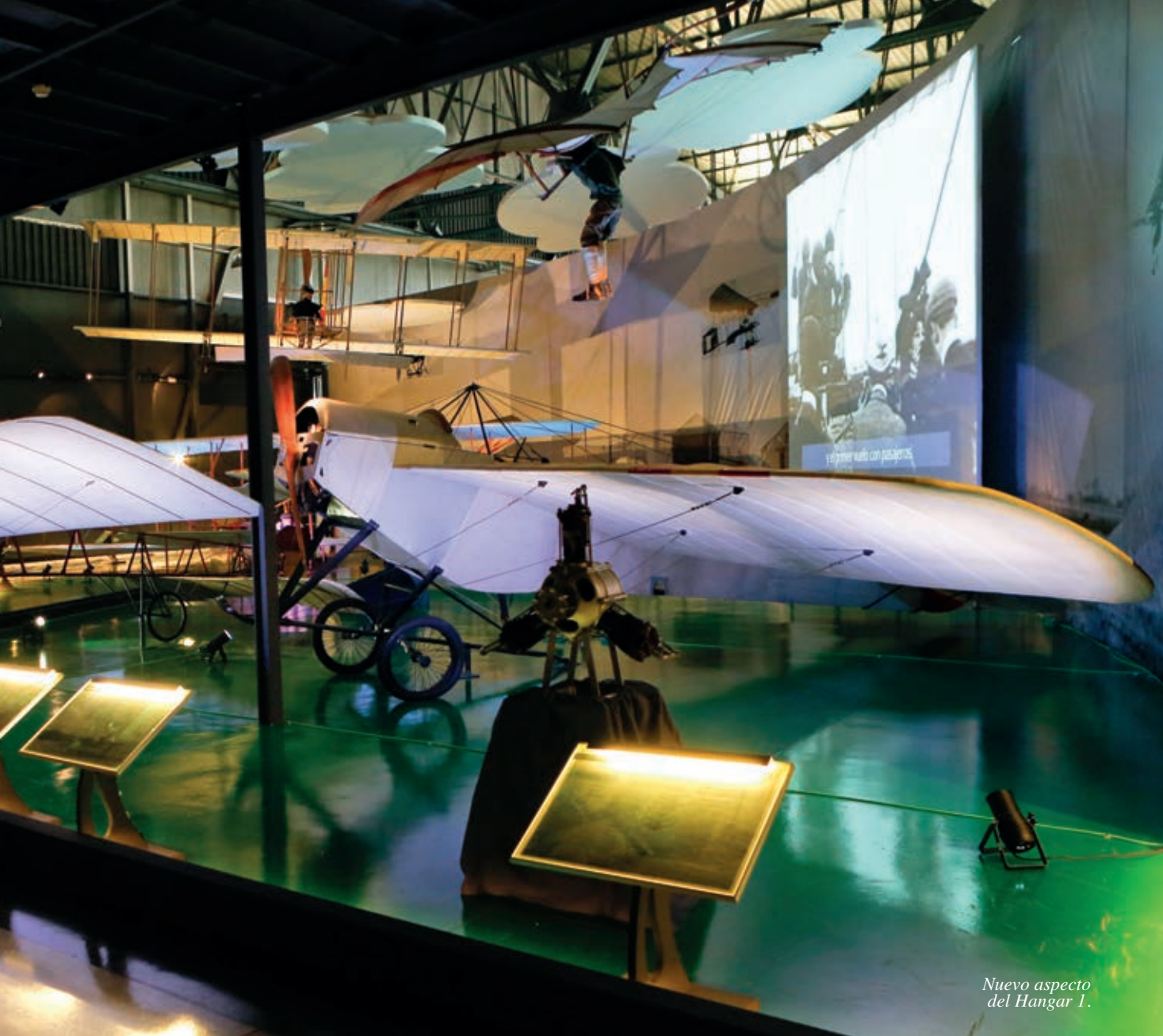
Nuevo aspecto del Hangar 1.