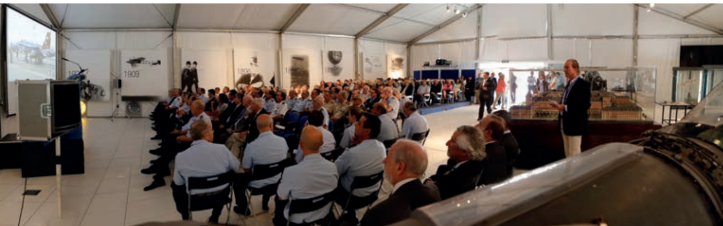
Panorámica de la Carpa del Museo el día de la inauguración del Hangar 1 remodelado.