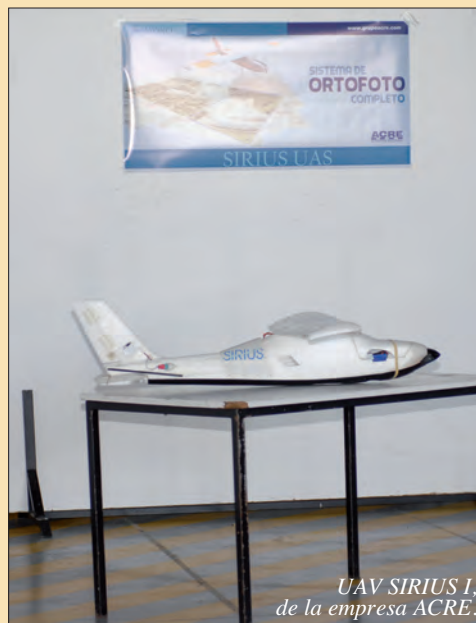
UAV SIRIUS I, de la empresa ACRE.

También mostró, aunque sólo en exposición estática, un Sistema de ala fija para aplicaciones cartográficas: SIRIUS I de MAVINCI. Se trata de un aeromodelo avanzado, con un sistema de navegación de origen militar. Puede llegar a fotografiar 400 hectáreas al día con una resolución espacial o geométrica de 4 cm; u 800 Ha./día, con resolución espacial de 10 cm. El techo del aeromodelo son 4000 m MSL, pudiendo operar con temperaturas de -20°C a + 45°C. Como sensor, lleva una cámara digital PANASONIC GX1 conectada al piloto automático para que en función del tamaño del pixel y la altura de vuelo se dispare automáticamente con la frecuencia óptima y con el recubrimiento necesario para poder generar el mosaico de fotos apropiado.