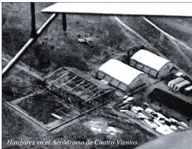
Hangares en el Aeródromo de Cuatro Vientos.

Actualmente, el Ejército del Aire cuenta con el Subsistema de Reconocimiento Aéreo Táctico: RECCELITE,