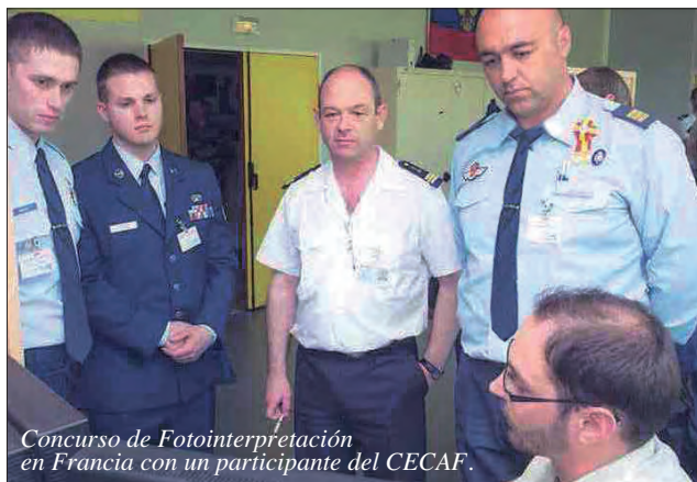
Concurso de Fotointerpretación en Francia con un participante del CECAF.

• Financiación mediante patrocinadores, de tal modo que esta actividad no reper-