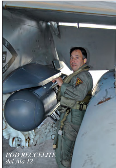
POD RECCELITE del Ala 12.

Es preciso señalar que las actividades de fotointerpretación se ejercen normalmente, en estrecha relación con los cometidos de inteligencia, sirviendo estas de herramienta para la misma. El hecho de que la inteligencia sea un área más extensa y que ofrezca un producto final más refinado, hace que las labores desempeñadas por los fotointérpretes sobre