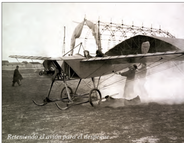
Reteniendo el avión para el despegue.