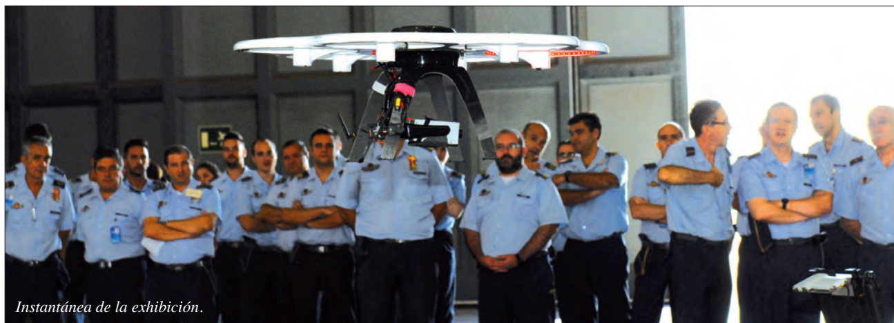
Instantánea de la exhibición.