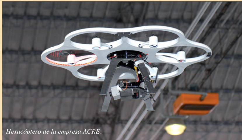
Hexacóptero de la empresa ACRE.

En tan solo 13 años de historia, el Grupo ACRE ha logrado abrir seis delegaciones en España, Portugal, Panamá, Marruecos, Colombia, Chile y Uruguay, además de realizar los más ambiciosos proyectos con algunas de las principales empresas de presencia internacional.